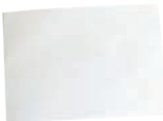
یک صفحه کاغذ