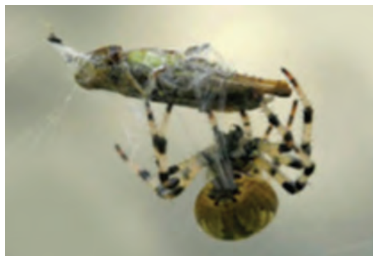
شکارچی و شکار