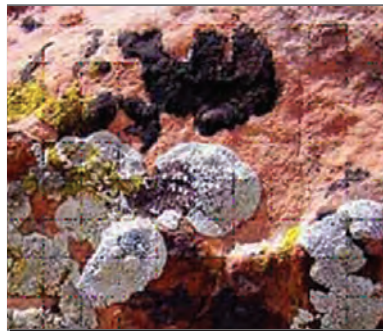
۲- گل سنگ ها جایگزین جلبک ها شده اند