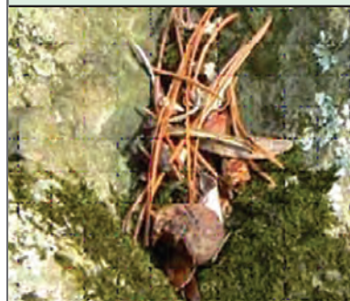
۴- یک شکاف در سنگ ایجاد شده و خاک تولید شده از بقایای به جا مانده از گل سنگ و خزه در این شکاف آماده پذیرش دانه های گیاهان می باشد