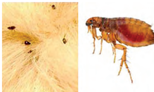
زندگی انگلی کک روی پوست جانوران

۳- انگلی: انگل از ارگانیسم دیگری که میزبان نام دارد تغذیه می‌کند ولی نه مانند شکارچی. انگل در دوره‌ای از سیکل زندگی میزبان خود، درون و یا روی میزبان زندگی می‌کند و از او تغذیه کرده و کم‌کم او را ضعیف می‌کند و میزبان طی این عمل یا می‌میرد و یا سالم باقی می‌ماند. گیاهان و جانوران هم می‌توانند انگل و هم میزبان انگلی دیگر باشند.