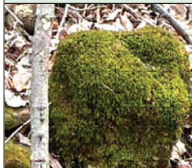
۳- سنگ پوشیده شده از خزه، خزه از بقایای گل سنگ ها استفاده می نماید

نحوه تحول جامعه زنده و به بیان دقیق تر، تحول و تکامل اکوسیستم را اصطلاحاً «توالی اکولوژیک» یا بلوغ اکوسیستم می نامند. ماهیت تحول و بلوغ جایگزین شدن منظم و جهت دار جامعه های زنده یکی به دنبال دیگری است. توالی با استقرار کم نیازترین جامعه ها آغاز می شود و هر جامعه ای شرایط محیط را برای استقرار جامعه ای دیگر و جامعه ای پرنیازتر از خود آماده می سازد. به تعبیری دیگر، علت توالی، نوسان توان رقابت جانداران به دنبال تحول در شرایط محیط است.