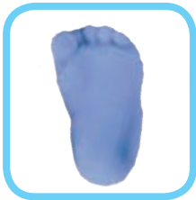
کف پای من

من امروز به دنیا پا گذاشتم، در حالی که گریه می کردم. خانم پرستار پایم را گرفت، جوهری کرد و روی یک کاغذ فشار داد تا با نوزاد دیگری عوض نشوم. پرستار هم دور دستم یک نوار بست که روی آن نوشته بود: