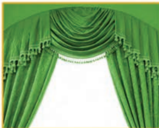
تصویر پرده با پارچه ضخیم