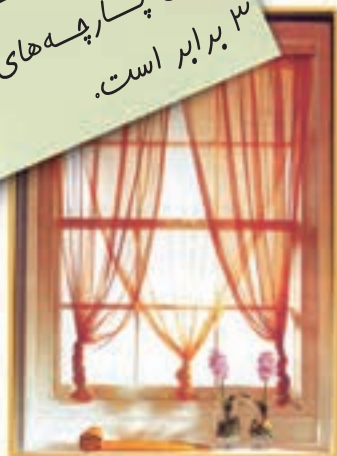
تصویر پرده با پارچه نازک

معمولاً اندازه عرض پرده برای پارچه‌های ضعیف ۲ برابر و برای پارچه‌های نازک ۳ برابر است.