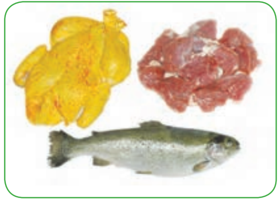
(مرغ، ماهی و گوشت)