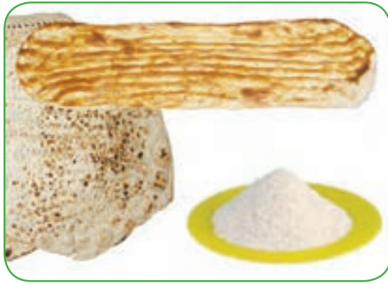
(برنج و نان)

تصاویر زیر گروه‌هایی از مواد غذایی را نشان می‌دهد که برای تغذیه صحیح مناسب است.