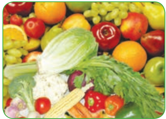
(سبزی و میوه‌ها)