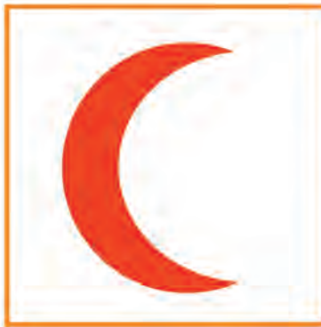
سازمان صلیب سرخ

درباره‌ی نشانه‌های زیر با دوستانتان صحبت کنید.