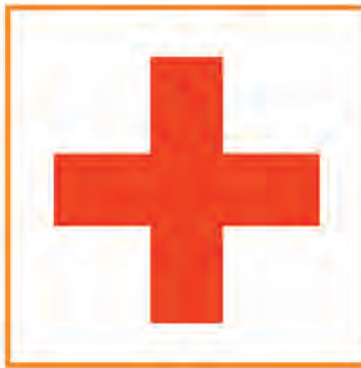
سازمان هلال احمر