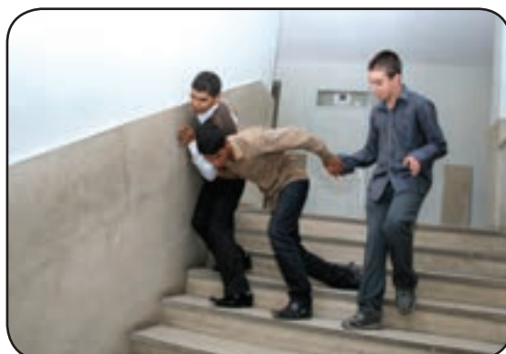
بازی و شوخی کردن روی پله‌ها