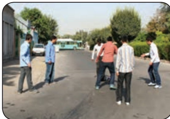
بازی کردن در وسط خیابان