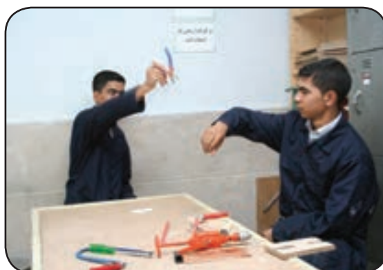
پرتاب کردن ابزار کار