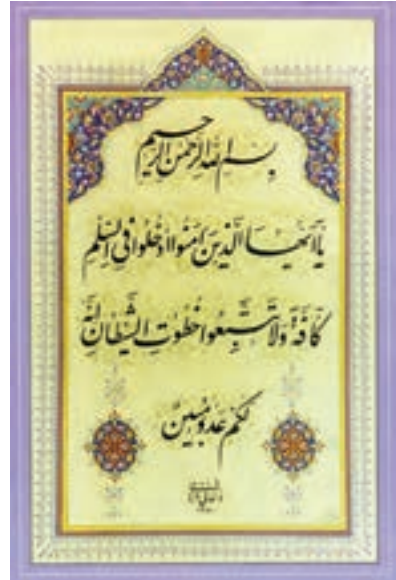
سوره بقره آیه ۲۰۸

یکی از تفاسیر بسیار خوب، تفسیر نمونه نام دارد که با همکاری جمعی از دانشمندان و زیر نظر آیت الله مکارم شیرازی در ۲۷ جلد تألیف شده است.