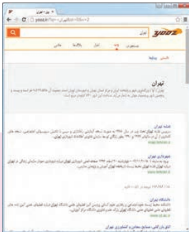
شکل ۳-۳. پیشنهاد‌های موتور جست و جو برای کلید واژه تهران