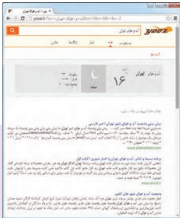
شکل ۳-۴. پیشنهاد‌های موتور جست و جو برای کلید واژه آب و هوای تهران

همان‌طور که در فیلم «کلید واژه» مشاهده کردید، پاسخ‌ها صفحاتی از وب را که دارای موضوعات متفاوتی درباره تهران باشند، شامل می‌شوند. به واژه‌هایی مانند «تهران» واژه عمومی می‌گویند زیرا به تنهایی نمی‌تواند در پیدا کردن پاسخ، به شما کمک کند. اگر با کلید واژه آب و هوای تهران جست و جو را ادامه دهید، می‌بینید که تعداد پیشنهادها کمتر شده و به موضوع آب و هوا نزدیک‌تر است.