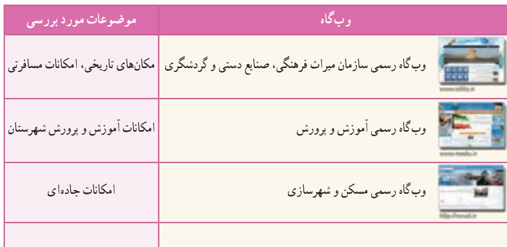
جدول ۷-۳- برخی وب‌گاه‌های معتبر برای جمع‌آوری اطلاعات

در بیشتر موارد نیازمند جست و جوی یک عبارت شامل چند واژه هستید.