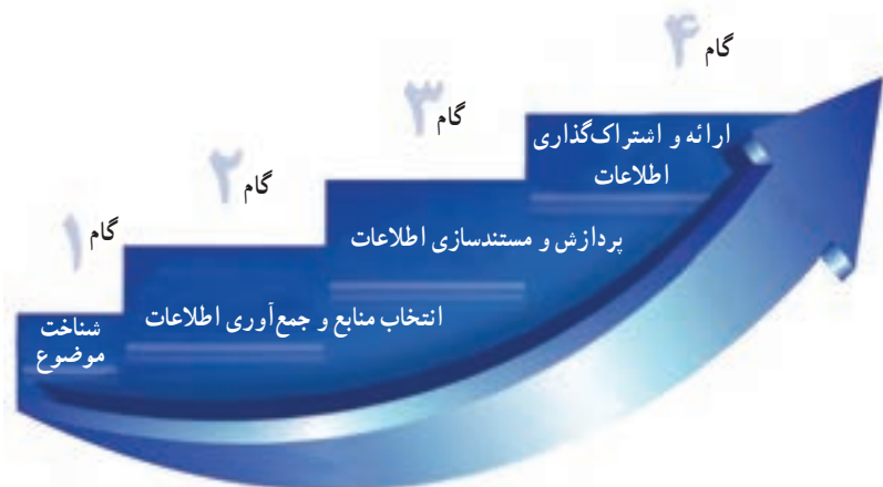
شکل ۱-۳- گام های جمع آوری اطلاعات