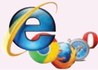
شکل ۳-۲- نماد برخی از مرورگرهای اینترنت

مرورگرهای وب و ویژگی‌های آن‌ها در گروه خود، مرورگرهای صفحات وب رایج و ویژگی‌های آن‌ها را بررسی کنید و آن‌ها را در جدول ۳-۶ بنویسید.