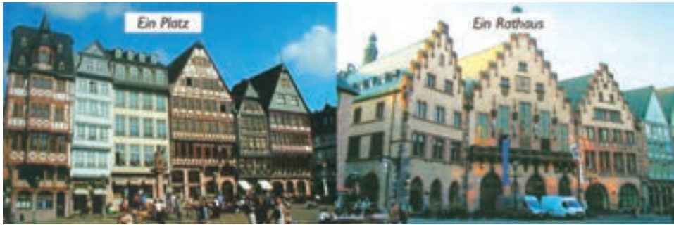
Einige Bilder aus Deutschland