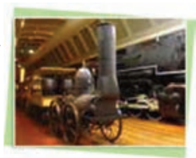
Die erste Einschienenbahn, 1884, von E.S. Watson

Was die wenigsten wußten: Die Idee ist keineswegs neu.