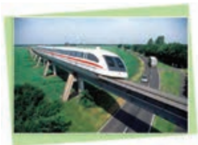
Der schnellste Zug der Welt.