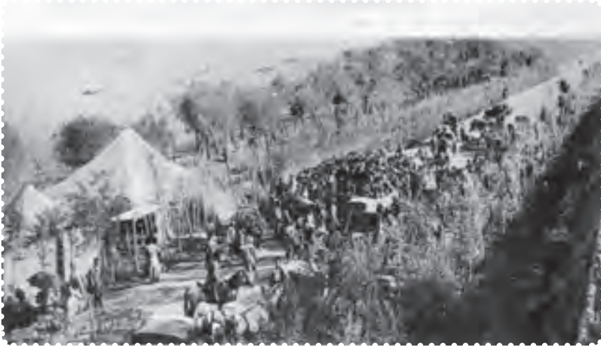
بازگشت علما از مهاجرت کبری

مظفرالدین شاه تسلیم خواسته‌های مردم شد. او عین‌الدوله را عزل کرد و فرمان تشکیل مجلس شورای ملی را در ۱۴ مرداد ۱۲۸۵ صادر کرد. هفت روز بعد، علما، با استقبال پرشکوه مردم، از قم بازگشتند. شهر چراغانی و جشن شادی به پا شد و در ۲۸ مرداد، اولین دوره مجلس شورای ملی با حضور نمایندگان تهران تشکیل گردید. عده‌ای از سیاستمداران مشروطه‌خواه، به تدوین قانون اساسی پرداختند. ۱ آنان با عجله آن را نوشتند و به امضای مظفرالدین شاه رساندند. شاه، ده روز پس از امضای قانون اساسی، درگذشت. به این ترتیب، کشور استبداد زده‌ی ما، با بهره‌گیری از اندیشه‌های سیاسی عالمان بزرگ دینی، کوشش فرهیختگان جامعه و مجاهدت مردم، به حکومتی دست یافت که می‌بایست براساس قانون اداره می‌شد.