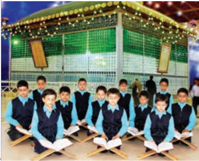
انس با قرآن کریم (استان تهران، شهرری، حرم امام خمینی)

از نمازخانه یا دفتر مدرسه به تعداد کافی، قرآن به کلاس بیاورید؛ هر میز حداقل یک قرآن داشته باشد. با راهنمایی آموزگار به صورت تصادفی قرآن را باز کنید. سپس دانش آموزان هر میز، آیات آن دو صفحه را برای یکدیگر می خوانند. آن گاه هر دانش آموز حدود یک سطر را با صدای بلند می خواند.