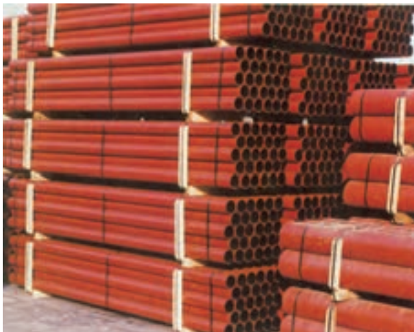
شکل ۱-۲- لوله ی چدنی بدون سرکاسه