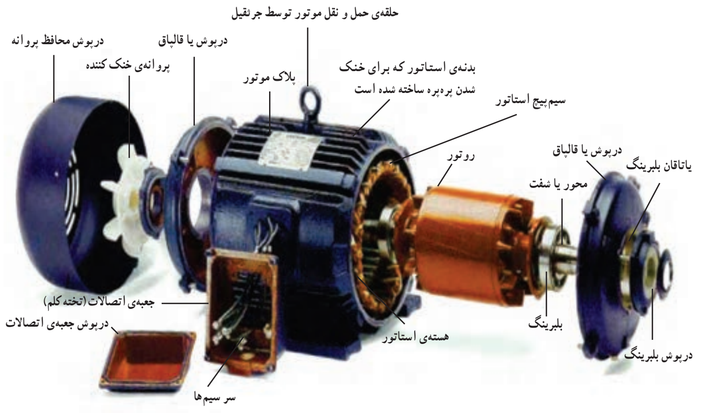
شکل ۱-۳- اجزای اصلی موتور سه فاز

یک الکتروموتور سه فاز از قسمت های مختلفی تشکیل شده است. این قسمت ها در شکل ۱-۳ نشان داده شده اند.