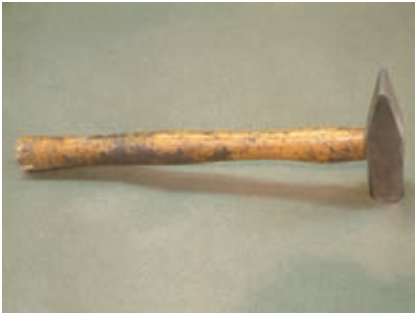
شکل ۹-۱- چکش فلزی

از چکش های پلاستیکی، بیش تر در جمع کردن قطعات موتور یا کوبیدن سیم پیچ های استاتور استفاده می شود؛ به عبارت دیگر می توان گفت در ضربه های ظریف از چکش های پلاستیکی استفاده می شود (شکل ۸-۱).