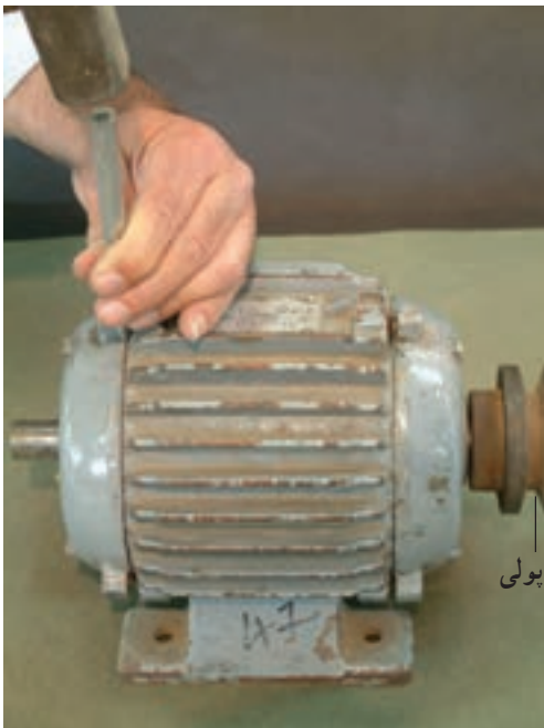
شکل ۱۰-۱- استفاده از چکش فلزی برای علامت گذاری در باز کردن قطعات موتور

درپوش ها از چکش های فلزی استفاده می شود (شکل های ۹-۱ و ۱۰-۱)