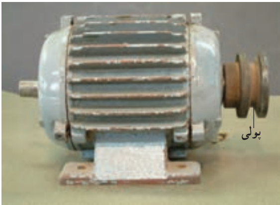
شکل ۱-۱ - موتور سه فاز کامل