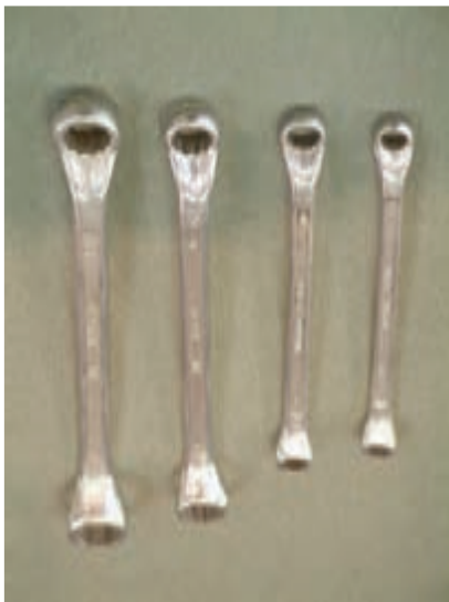
شکل ۱-۶- آچار رینگ

در مواقعی که پیچ یا مهره در سطح کار دستگانه نباشد و نسبت به سطح، عمق کمی داشته باشد به گونه‌ای که فک‌های آچارهای تخت نتوانند پیچ یا مهره را بگیرند از آچارهای رینگ استفاده می‌شود. آچارهای رینگ، نظیر آچارهای تخت، به فضای کافی جهت گردش دسته‌ی خود نیاز دارند (شکل ۱-۶).