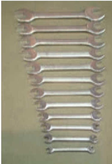
شکل ۱-۵- آچارهای تخت

۱-۲-۱- انواع آچار: برای باز کردن و سوار کردن اجزای موتورهای الکتریکی اغلب از آچارهای تخت، آچار بوکس و آچار رینگ استفاده می‌شود. از آچارهای تخت برای باز و بسته کردن پیچ و مهره‌هایی که در سطح کار قرار دارند و فضای کافی برای گردش دسته آچار موجود باشد استفاده می‌شود (شکل ۱-۵).