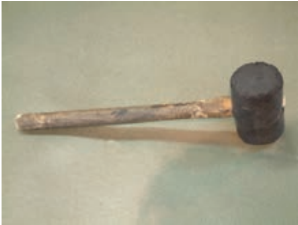
شکل ۸-۱- چکش پلاستیکی