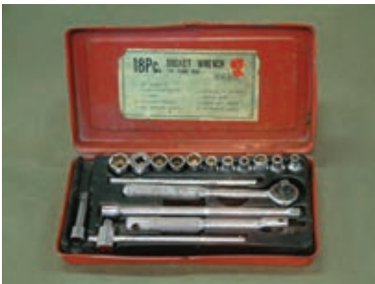
شکل ۱-۷- آچار بوکس

در بعضی مواقع، پیچ و مهره‌ها در عمق زیادتری قطعات داخلی را به هم دیگر ارتباط می‌دهند لذا آچارهای تخت و رینگ قادر به باز و بسته کردن پیچ و مهره‌ها نخواهند بود که در این صورت از آچار بوکس استفاده می‌شود (شکل ۱-۷).