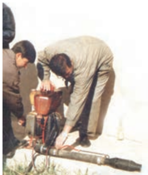
شکل ۲۵-۳- آماده سازی و روشن کردن شعله افکن

۷- گاز دستگاه را به میزان مورد نیاز تنظیم نمایید.