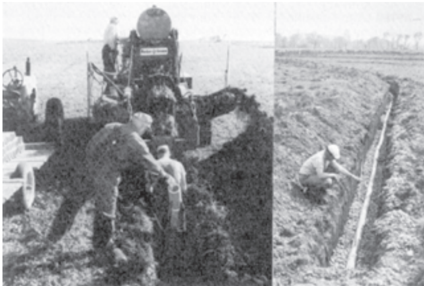
شکل ۲-۴ زهکشی

نباشد، باید گیاهانی کاشته شوند که مقاوم به کمبود اکسیژن در خاک هستند مانند برنج. چنانچه سطح آب تحت‌الارض در نیم‌متری عمق خاک باشد، باید از گیاهانی نظیر سیب‌زمینی، توت‌فرنگی و نیشکر استفاده کرد. چنانچه آب تحت‌الارضی بالا باشد، با رعایت