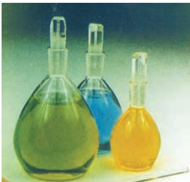
شکل ۳-۱ انواع پیکنومتر