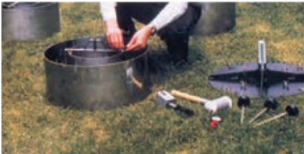
شکل ۳-۱ نحوه کار گذاشتن استوانه مضاعف