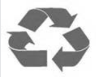
نماد بین‌المللی بازیافت

● بازیافت به آماده‌سازی مواد برای بهره‌برداری دوباره گفته می‌شود. به تعریفی دیگر بازیافت عبارتست از فرآیند پردازش مواد مصرف شده به محصولات و مواد تازه به منظور جلوگیری از به هدر رفتن مواد سودمند بالقوه، کاهش مصرف مواد خام و انرژی و کاهش آلودگی هوا، آب و خاک ناشی از دفع زباله‌ها. مواد قابل بازیافت چیزهای