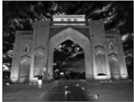
دروازه قران جدید، شیراز