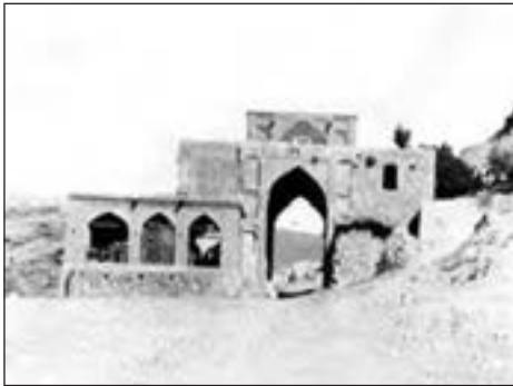
دروازه قران قدیم، شیراز

در صورت امکان تعدادی عکس از محله‌های قدیمی و جدید شهر خودتان پیدا کنید و به کلاس ببرید و از دانش‌آموزان بخواهید شباهت‌ها و تفاوت‌های عکس‌ها را بگویند و آنها را با یکدیگر مقایسه کنند و به این ترتیب بفهمند که محله‌ها در طول زمان دچار تغییر می‌شوند.