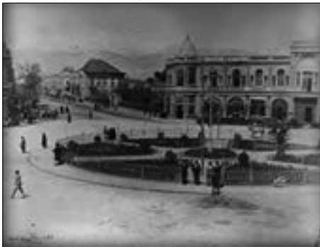
میدان حسن‌آباد قدیم، تهران