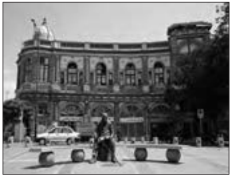
میدان حسن‌آباد جدید، تهران