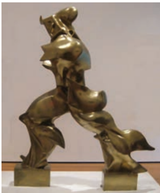
تصویر ۶- صور یگانه از استمرار در فضا، اثر امبرتو بوتچونی، ۱۹۱۳ م