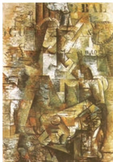
تصویر ۵- پرتغالی‌ها، اثر زرژ براک، کوبیسم ترکیبی، رنگ و روغن، ۱۹۱۱ میلادی

فوتوریست‌ها بیشترین استقبال را از جنبش کوبیسم کردند. آنها تلاش کردند صورت پویاتری از کوبیسم را ارائه کنند. فوتوریست‌ها به‌ستایش دنیای نوین، ماشین، سرعت و خشونت پرداختند. آنها می‌خواستند هنر را به زندگی نزدیک کنند و حرکت را جوهر زندگی امروزی می‌دانستند. تأکید آنها بر نور و حرکت بود. دوران شکوفایی این جنبش در پایان جنگ جهانی رو به‌زوال گذاشت. بوتچونی ۷ از بزرگان این جنبش است که تلاش دارد حرکت و انرژی را در آثارش جلوه‌گر سازد (تصویر ۶).