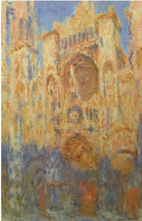
تصویر ۱۵- منظره کلیسای روئن در غروب آفتاب، اثر کلود مونه، رنگ و روغن روی بوم، موزه هنرهای زیبای بوستون

اصطلاح امپرسیونیسم را در سال ۱۸۷۴م، روزنامه‌نگاری به‌ریشخند در مورد یکی از منظره‌های کلود مونه ۱ (امپرسیون: طلوع آفتاب) به‌کاربرد. مونه نماینده واقعی این جنبش است. او بیست و شش منظره از کلیسای روئن ۲ را نقاشی کرد (تصویر ۱۵). در هر تابلو، کلیسا از یک نقطه دید ثابت ولی در ساعات متفاوتی از روز و در شرایط اقلیمی و جوی متفاوتی نقاشی شده است. پیسارو ۳ و رنوار ۴ از شاخص‌ترین امپرسیونیست‌ها هستند. عامل پیونددهنده این نقاشان «حساسیت به رنگ» و «جلوه‌های ناپایدار نور و حرکت» است. نور نقش اصلی را در نقاشی امپرسیونیستی ایفا می‌کند و وظیفه هنرمند ثبت دقیق و فوری ارتعاشات زودگذر نور است. امپرسیونیست‌ها بیشتر در فضای باز نقاشی می‌کردند.