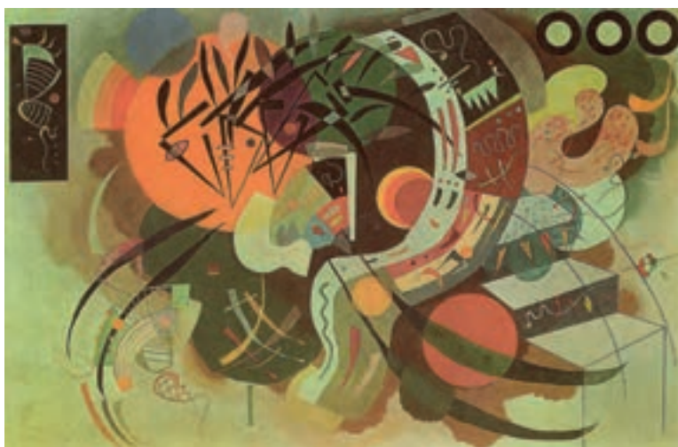
تصویر ۹- هنر انتزاعی، منحنی مسلط، اثر کاندینسکی

معمولاً کاندینسکی ۲ را مبتکر نقاشی انتزاعی و فیلسوف و نظریه‌پرداز این شیوه می‌دانند. وی مانند نقاشان قدیم روسی با جهان‌نگری عارفانه خویش هیچ‌گاه هنر را تقلیدی از جهان مادی نمی‌دانست. در ابتدا شروع و حرکت در این مسیر به شجاعت و تخیل فوق‌العاده‌ای نیاز داشت. اما امروزه هنر انتزاعی بخشی از زندگی ما شده است (تصویر ۹).