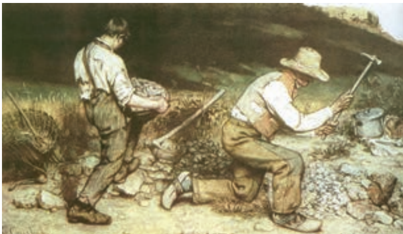
تصویر ۱۱- سنگ شکنان، اثر گوستاو کوربه، نگارخانه دولتی، درسدن (این تابلو در جنگ دوم جهانی نابود شد)

رئالیسم در میانه سده نوزدهم به وجود آمد که واکنشی در برابر خصلت آرمانی کلاسیسیسم و خصلت عاطفی و ذهنی رمانتیسیسم بود. انسان‌دوستی و علاقه به اصلاحات اجتماعی موضوعی بود که به تمام زوایای زندگی و هنر سده نوزدهم راه پیدا کرد. آنچه به نظر هنرمند جالب می‌آمد، اکنون در محیط خود او وجود داشت و این موضوع جالب، مردم - همان‌گونه که هستند - بود. نقاشی رئالیستی بازنمایی بدون آرمانگری در مفهوم صحنه با تمام خصوصیات پسندیده و ناپسندیده بود. این نهضت با کوربه ۴ آغاز می‌شود. تابلوی «سنگ شکنان» او نخستین نمونه تمام‌عیار نقاشی به این شیوه است. او معتقد بود که هنرمند باید فقط چیزهای مرئی و ملموس را بازنمایی کند. او موضوعاتی چون زندگی و کار تهیدستان را انتخاب می‌کرد و راه را برای نقاشان دیگر حتی با دیدگاه‌های متفاوت گشود (تصویر ۱۱).