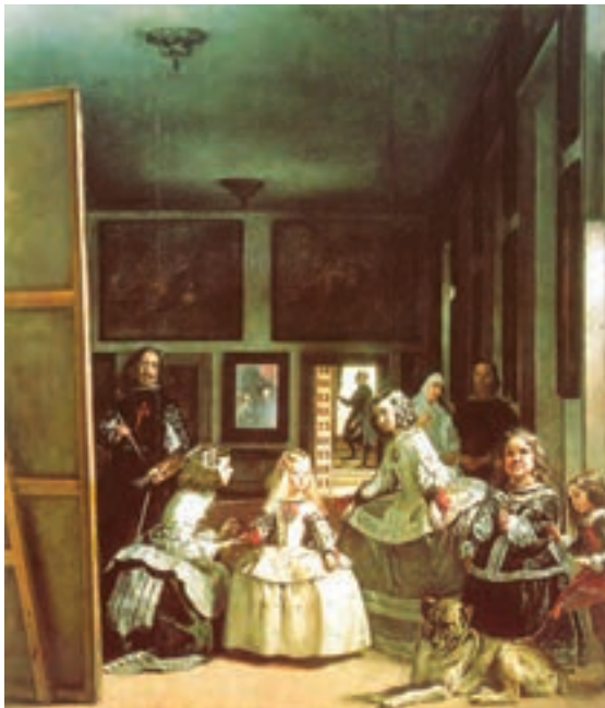
تصویر ۴- تصویر ندیمه‌ها اثر و لاسکوئز، رنگ و روغن، سال ۱۶۵۶ میلادی، مادرید

نقاشان باروک در نمایش طبیعت به واقعیت وفادار بودند و در آثارشان به رنگ، بافت، محاسبه روشنایی و تاریکی، استفاده از نور برای جلب توجه، حالت نمایشی، فضای پر و خالی و جلوه‌های غیر مترقبه اهمیت می‌دادند. از ویژگی‌های نقاشی باروک رواج نقاشی‌های علمی، تجسم فرهنگ و ادبیات عامه و آدم‌های معمولی، طبیعت بیجان، نقاشی منظره، نقاشی سقفی (تصاویر ۳ و ۴)، از هنرمندان برجسته این دوره می‌توان به کارا و ادجو ۳ ، دیه گو و لاسکوئز ۴ و رامبراند ۵ اشاره کرد.