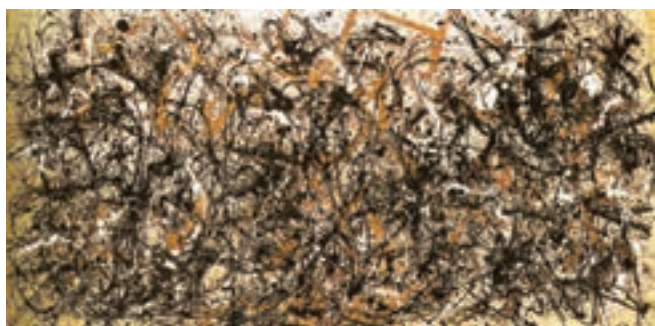
تصویر ۱۳- اکسپرسیونیسم انتزاعی، اثر جکسون پولاک، ۱۹۵۰ میلادی، رنگ و روغن و رنگ لعابی روی بوم بدون آستر، موزه هنر مدرن، نیویورک

نوعی نقاشی عاری از تصویر و فاقد شکل‌های بنیادی (مانند اشکال هندسی) و روشی خودانگیخته و پویا و قلمزنی آزاد به‌شمار می‌رود. نقاشی‌های پولاک ۲ بیان‌گر این شیوه است. نقاشی‌های او بازتابی از شرایط کلی زندگی بی‌قرار انسان غربی پس از تجربه دو جنگ جهانی است (تصویر ۱۳). از نظر او و همه هنرمندان اکسپرسیونیست انتزاع‌گرا، اثر هنری نتیجه عمل مهارنشده هنرمند است و هیچ مضمونی را بیان نمی‌کند. اکسپرسیونیسم انتزاعی نخستین جنبش هنری مهم در سال‌های بعد از جنگ جهانی دوم و اصیل‌ترین و متمایزترین دستاورد تاریخ هنر آمریکا دانسته شده است.