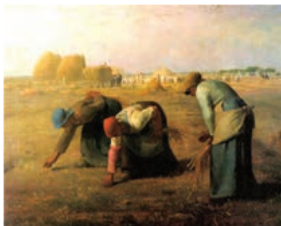
تصویر ۱۴- خوشه چینان، اثر ژان فرانسوا میله، ۱۸۵۷ میلادی، رنگ و روغن روی بوم، موزه اورس، پاریس