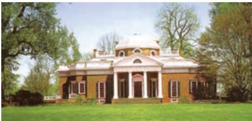
تصویر ۹- خانه توماس جفرسن رئیس جمهور امریکا، سده ۱۸ میلادی، ویرجینیا، امریکا