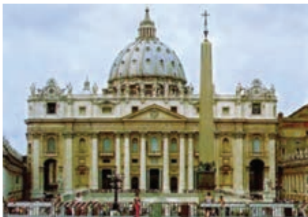
تصویر ۱- کلیسای سن پیر روم، نما اثر کارلو مادرنو، ستون کاری اثر برنینی، حدود ۱۶۱۲-۱۶۰۷ میلادی

معماری باروک با ساخت کلیساهای بزرگ از شهر رُم شروع شد. معماران این عصر نیز مانند دوره رنسانس هم پژوهشگر و هم در چند رشته تخصص داشتند، معماری باروک بنا به سلیقه معمار یا سفارش‌دهنده از سنت‌های مختلفی چون کلاسیک باستان، گوتیک و رنسانس در یک بنا سود می‌برد و تلاش می‌کرد بین عناصر مختلف هماهنگی ایجاد کند. در معماری باروک استفاده از شکل بیضی به جای دایره در گنبدها، پنجره‌ها و سقف رایج شد. سطوح محدب و مقعر، تأکید بر مرکز ساختمان، ارتباط معماری با فضای پیرامون، تأکید تزئینات داخلی و تلاش برای هماهنگی میان معماری، نقاشی و تندیس‌سازی بود. کارلو مادرنو ۲ و برنینی ۳ از بنیان‌گذاران معماری باروک در شهر رُم بودند. نما و صحن بیرونی