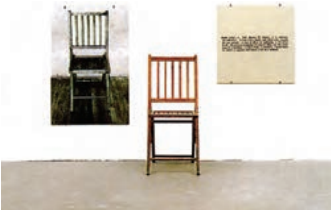
تصویر ۱۵- هنر مفهومی، یک و سه صندلی اثر جوزف کازوت، ۱۹۶۵

شکل‌های جدید هنر: از سوی دیگر محیط ۲ ، چیدمان ۳ و اجرای نمایشی ۴ و تمام جاذبه‌های هنری مستتر در این سه عنصر توجه هنرمندان را به خود جلب کرد. امروزه فعالیت‌های نمایش گونه و ژست‌های اجتماعی، رخداد هنری تلقی می‌شوند. هنر جدید در اشکال هنرچیدمان، هنر ویدئو، هنر عکس و هنر محیطی ظاهر شده است (تصویر ۱۷).