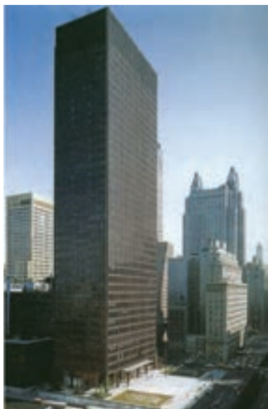
تصویر ۱- معماری مدرن ساختمان سیگرم، نیویورک، سال ۱۹۵۸-۱۹۵۴

معماری مدرن ابتدا از اروپا شروع شد و سپس در آمریکا رونق گرفت. معماری مدرن دو مسیر را ادامه داد، یکی معماری ماشین‌وار که معتقد بود شکل بنا باید تابع عملکرد آن باشد و دیگری معماری شخصی که بیانگر، جذاب، متمایل به جلوه‌های تزئینی و استفاده از عناصر معماری گذشته بود. بتون مسلح، آهن و شیشه نقش مهمی در اشکال معماری قرن بیستم داشت. معماری ماشین‌وار مدرن اغلب با ساختمان‌های مکعب‌گونه و آسمان‌خراش‌ها در مراکز شهری مشخص می‌شود (تصویر ۱ و ۲).