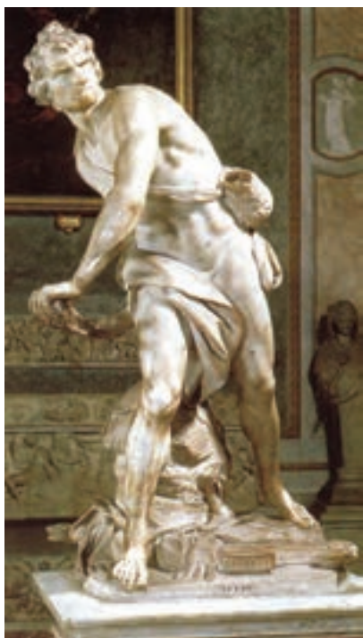
تصویر ۶- داوود در حال پرتاب سنگ به سمت جالوت، اثر برنینی، سنگ مرمر، سال ۱۶۲۳ میلادی، روم (مقایسه کنید با داوود میکلا آنژ)

تندیس‌سازی باروک نیز همانند نقاشی بسیار زنده، پرشور و چشمگیر است و بیان‌گر تلاش هنرمند در ارائه احساسات عمیق انسان است و تلاش دارد واکنش تماشاگر را برانگیزد (تصویر ۵). تندیس داوود در حال پرتاب سنگ به جالوت اثر برنینی سرشار از بیان احساس، تحرک و پویایی است (تصویر ۶).