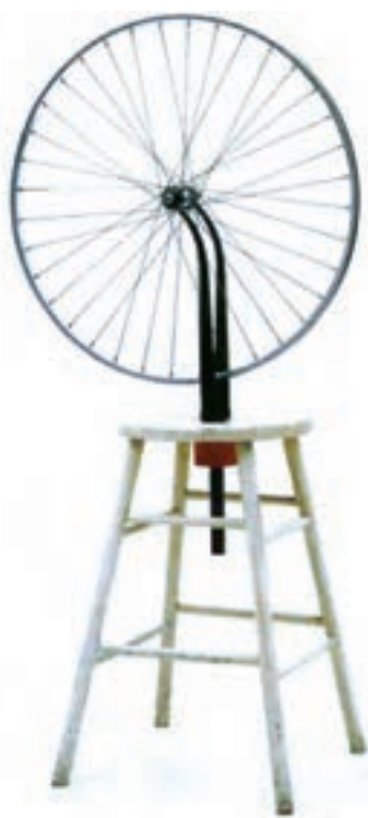
تصویر ۷- دوچرخه فلزی سوارشده روی پایه چوبی رنگ آمیزی شده، اثر مارسل دوشان، هنر دادائیسم ۱۹۱۳ م، موزه هنر مدرن، نیویورک

سورئالیسم از درون دادائیسم بیرون آمد و اغلب دادائیست‌ها مثل دوشان، به جنبش سورئالیسم پیوستند. آنها قصد تلفیق امور معقول و غیر معقول را داشتند. سورئالیسم تجربه شاعرانه‌ای در یکی کردن انسان با جهان درونی‌اش است. اوج این جنبش دهه ۱۹۳۰ و مهمترین و نیرومندترین جنبش هنری سال‌های بین دو جنگ جهانی بود. دالی ۴ از هنرمندان مشهور این مکتب بود. بلافاصله پس از شروع جنگ جهانی دوم بسیاری از این هنرمندان به ایالات متحده (نیویورک) کوچ کردند و به طور جدی منشأ حرکت و تحول در میان هنرمندان آمریکایی گردیدند (تصویر ۸).