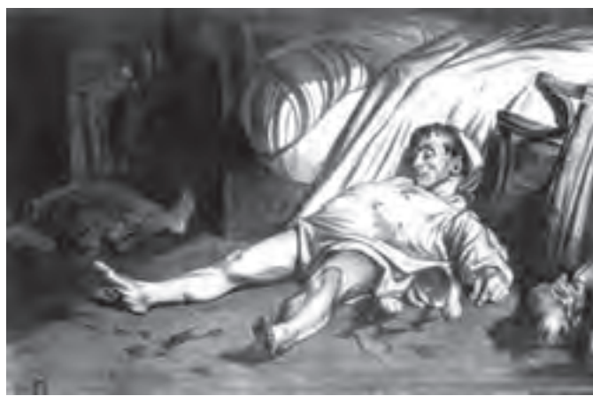
تصویر ۱۳- خیابان ترانسنون، اثر اونوره دومیه، ۱۸۳۴، گراور، ۴۵×۳۰ سانتی متر، موزه هنری فیلادلفیا