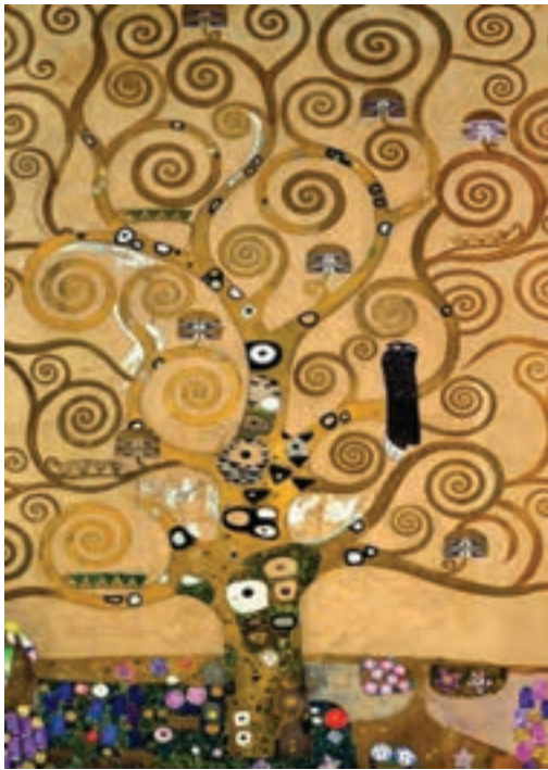
تصویر ۲۰- بخشی از اثر درخت زندگی، سمبولیسم، اثر کلیمت

یا نمادی از تجربه درونی آن واقعیت کردند. تفسیرهای آزادانه هنرمند از طبیعت جای شکل‌های قطعی جهان مرئی را گرفت و کم‌کم اسلوب کار هنرمند شخصی‌تر شد. هنرمند با رد شکل‌های قراردادی، از سلطه مفاهیم و معانی قراردادی نیز بیرون می‌آید. وظیفه هنرمند جستجوی سرچشمه‌های پنهان و مرموز آدمی است. آنها به دنبال کشف و شهود بودند. سمبولیست‌ها در بیانیه‌ای اعلام کردند «ما به استقلال هنر باور داریم، هنر برای ما وسیله نیست بلکه هدف است. هر هنرمندی که چیزی جز زیبایی در نظر گیرد، در نظر ما هنرمند نیست...». شعار «هنر برای هنر» شیوه زندگی آنها بود. کلیمت ۱ از نقاشان جنبش سمبولیست می‌باشد (تصویر ۲۰).