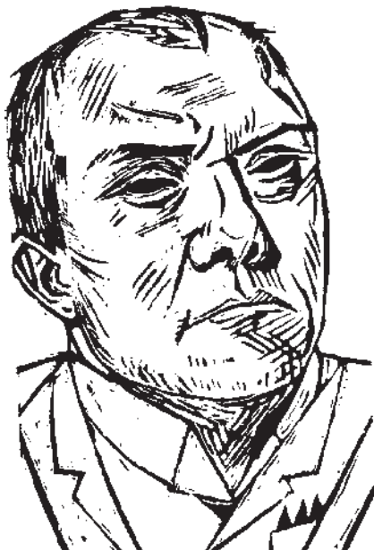
تصویر ۱۲- تک‌چهره خود هنرمند (باسمه)، اثر ماکس بکمان، نئورئالیسم دهه ۱۹۲۰

درآلمان پس از جنگ اول جهانی، آشفته‌گی اجتماعی و سیاسی به اوج می‌رسد. نسل جنگ سعی می‌کند با تیزبینی بر تباهی اخلاقی و بینوایی اجتماعی انگشت بگذارد. چنین بینشی فقط می‌تواند با نوعی واقعگرایی تند و گزنده بیان شود. پس هنر به سلاح حمله و دفاع و وسیله‌ای برای نقد و تبلیغ بدل می‌شود. به این ترتیب شکل‌های مختلف واقع‌نمایی به‌عنوان واکنشی منفی در برابر انتزاع شکل می‌گیرد. «بکمان» ۳ مفهومی نوین از واقعگرایی را مطرح کرد. او سبک‌های مختلفی را در زندگی تجربه نمود. برای بکمان هیچ چیز مهمتر از بازنمایی و محتوا نبود. پرده‌های او در نقطه مقابل هنر تزئینی یا «نقاشی برای نقاشی» قرار دارند. در آثار او انسان، موقعیت او و حالات ذهنی‌اش با واقعیت تمام در برابر تماشاگر ظاهر شده‌اند (تصویر ۱۲).