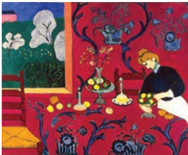
تصویر ۳- میز غذاخوری، اثر هانری ماتیس، ۱۹۰۸ میلادی، موزه هرمیثاژ، سن پترزبورگ