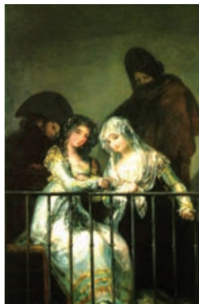
تصویر ۱۲- زنان در بالکن، اثر فرانسیسکو گویا، ۱۸۱۵-۱۸۱۰ میلادی، رنگ و روغن روی بوم، موزه هنر متروپولیتن، نیویورک

دومیه ۲ نیز با تکنیک چاپ سنگی مقدار زیادی کاریکاتورهای اجتماعی و سیاسی برای چاپ در مجلات و روزنامه‌ها ساخت (تصویر ۱۳). میله ۳ (میله) نقاشی است که تمایلات هر دو مکتب واقع‌گرایی و رمانتیک را در آثارش می‌توان دید (تصویر ۱۴).