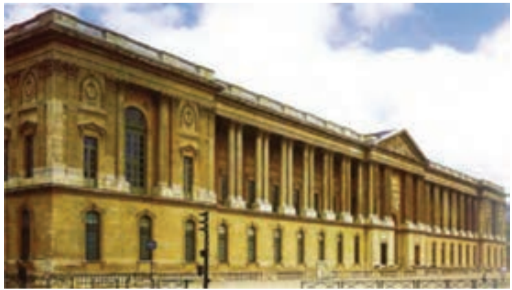
تصویر ۲- نمای شرقی کاخ لوور، سال ۱۶۷۰-۱۶۶۷ میلادی، پاریس (در حال حاضر موزه لوور)

کلیسای سن پیر ۱ در رُم کار مادرنو و ستون کاری آن کار برنینی است (تصویر ۱). برنینی از معماران و تندیس‌سازان بزرگ شهر رُم بود، وی پیرو سنت کلاسیک باستان بود و خود را جانشین میکل‌آنژ می‌دانست، تزینات پُر تجمل صحن داخلی کلیسا از نمونه کارهای او است. کاخ لوور ۲ از آثار باشکوه معماری باروک است. این بنا متأثر از سنت کلاسیک باستانی است اما ستون‌های دو تایی آن ابتکار جدیدی بود که در معماری فرانسه رواج یافت (تصویر ۲).