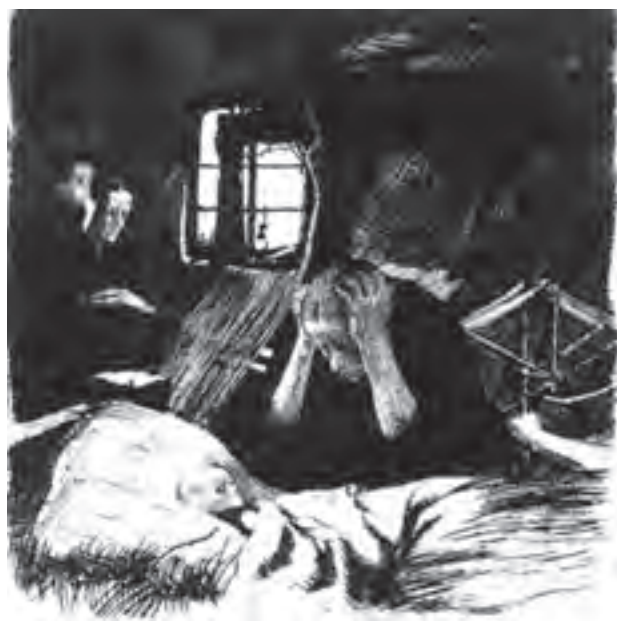
تصویر ۴- نیاز، اثر کته کُل ویتس، اکسپرسیونیسم سال‌های ۱۹۰۱-۱۸۹۳ میلادی، چاپ سنگی

نُلده ۱ ، کُل ویتس ۲ و ... ماندگارترین آثار اکسپرسیونیستی را آفریدند. آنها در وحشتناک‌ترین لحظات سده بیستم یعنی زمان استبداد نازی بر تمدن اروپایی می‌زیستند و شاهد مستقیم کشتارها و فساد آلمان در سال‌های پس از جنگ بودند (تصویر ۴).