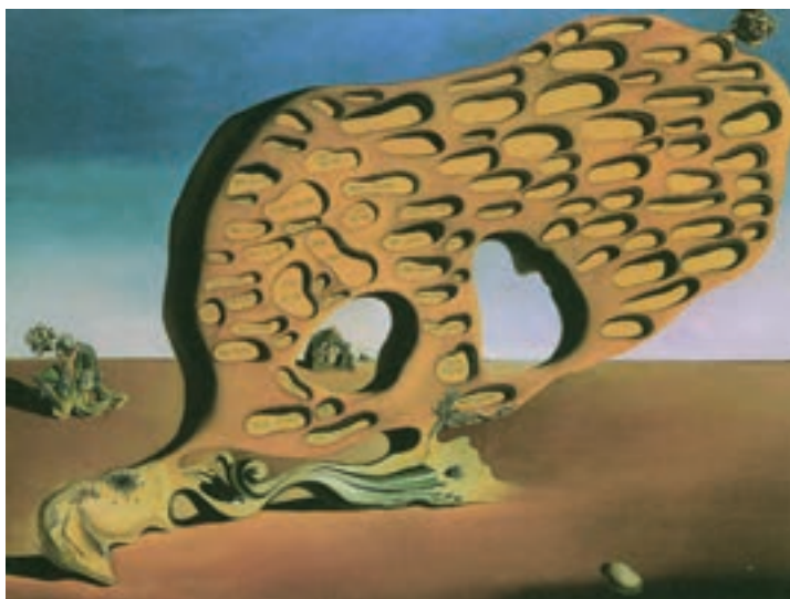
تصویر ۸- غربال آرزوی نفسانی، اثر سالوادوردالی، ۱۹۲۹، رنگ و روغن روی بوم