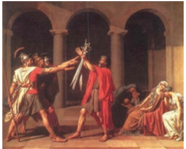
تصویر ۸- سوگند هوراتیوس‌ها، اثر ژاک لویی داوید، ۱۷۸۴م، رنگ روغن روی بوم، ۴۲۰×۳۳۰ سانتی‌متر، موزه لوور، پاریس

نئوکلاسیسیسم سبکی هنری است که در نیمه دوم سده هجدهم واکنشی علیه باروک و روکوکو به‌شمار می‌رود. از سوی دیگر گرایش به هنر آرمانی یونان و روم به‌عنوان تقلید از طبیعت در این مکتب شکل گرفت. هنرمند معروف این سبک داوید ۲ (۱۸۲۵-۱۷۴۸م) است. او در برابر سبک روکوکو طغیان کرد و سنت‌های کلاسیک را از نو به سبک فردی خود احیا نمود (تصویر ۸). تصویر ۹ نمونه‌ای از معماری نئوکلاسیک می‌باشد که از ستون‌ها و نمای معماری کلاسیک یونان تأثیر گرفته است.