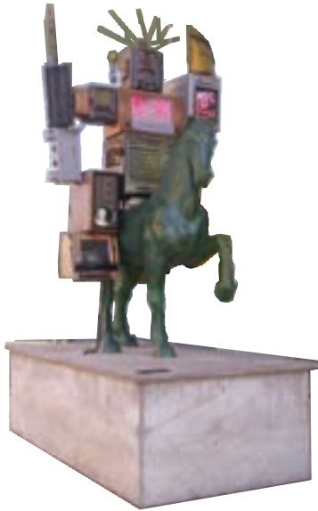
تصویر ۱۸- هنر پُست مدرن، سوارکار، اثر نام جوم پایک، موزه ارتباطات فرانکفورت. (شاید هنرمند وسایل رایانه‌ای و دیجیتال را دون‌کیشوتی در عصر حاضر معرفی می‌کند.)