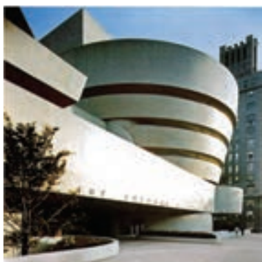
تصویر ۲- معماری مدرن، ساختمان موزه سالمون، نیویورک، سال ۱۹۵۹-۱۹۵۶

نخستین نشانه‌های یک نهضت جدید، در سال ۱۹۰۵ در نمایشگاهی به پیشگامی «هانری ماتیس» ۳ ظهور کرد. آشنایی هنرمندان با فرهنگ غیراروپایی راه‌های تازه‌ای را برای انتقال عواطف پیش پای آنها گذاشت. نقاشی‌های آنها از نظر طرح ساده و از لحاظ رنگ درخشان بود. در این نمایشگاه منتقدی آنها را «فووها» (حیوان وحشی) نامید. آنها با در کنار هم قراردادن رنگ‌های متضاد قدرت و شدت تازه‌ای به رنگ بخشیدند. نمایش کنش عاطفی هنرمند به موضوع کارش با استفاده از شدیدترین رنگ و قوی‌ترین خط، از هر شبیه‌سازی مهمتر بود (تصویر ۳).