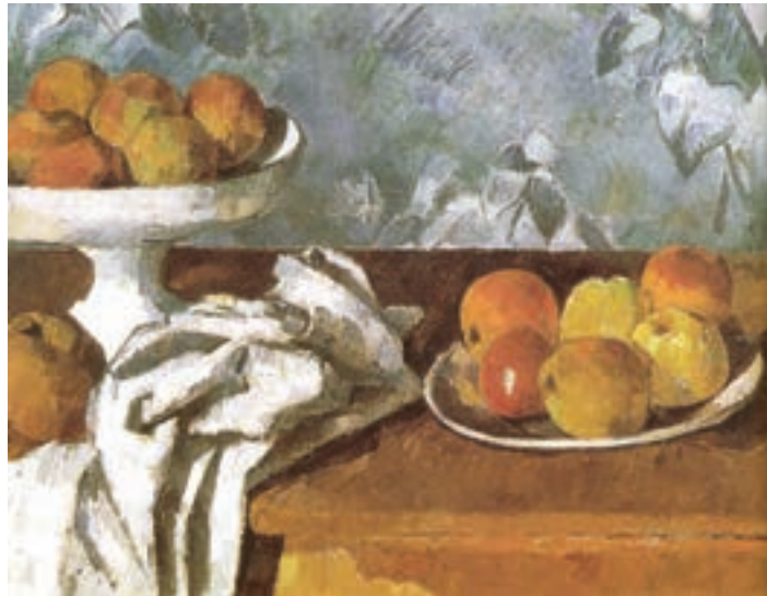
تصویر ۱۷- نقش اشیا، اثر پل سزان، حدود سال‌های ۱۸۸۲-۱۸۷۹ میلادی، رنگ روغن روی بوم، ۴۶×۵۵ سانتی‌متر، کلکسیون خصوصی

«سزان» ۶ از دیگر نقاشان این مکتب، با روش علمی در صدد یافتن قواعد جدیدی برای نظم دادن به تجربه و ادراک رنگ بود (تصویر ۱۷). از نظر سزان «نقاش باید طبیعت را به شکل استوانه، کره و مخروط نشان دهد».