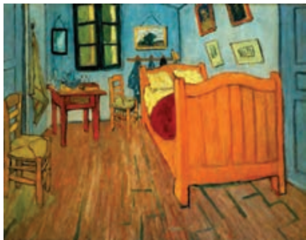
تصویر ۱۸- اتاق نقاش در آرل، انرونسان ون گوگ، سال ۱۸۸۹ میلادی، رنگ روغن روی بوم، موزه اورسی، پاریس

در آثار هنری تولوز-لوترک ۲ زندگی معاصر با کاریکاتوری دل‌تنگ‌کننده و زنده بیان می‌شود. گراورهای ژاپنی بر کار او بسیار تأثیرگذار بودند. او با ساده کردن پیکره‌ها و چهره‌ها دخل و تصرفاتی در آنها به وجود آورد که زمینه‌ای برای اکسپرسیونیسم شد و نوآوری‌هایی انقلابی در هنر پوستر به وجود آورد (تصویر ۱۹).