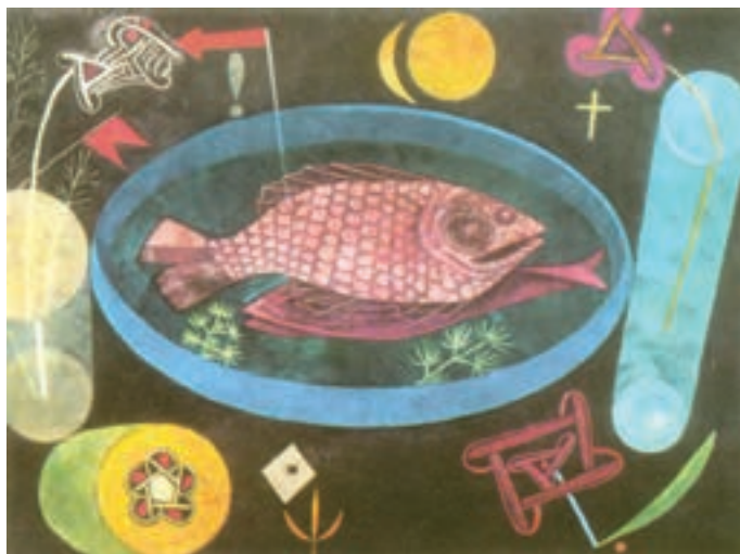
تصویر ۱۰- اطراف ماهی، اثر پل کله، هنر انتزاعی، رنگ و روغن روی بوم، ۱۹۲۶ میلادی