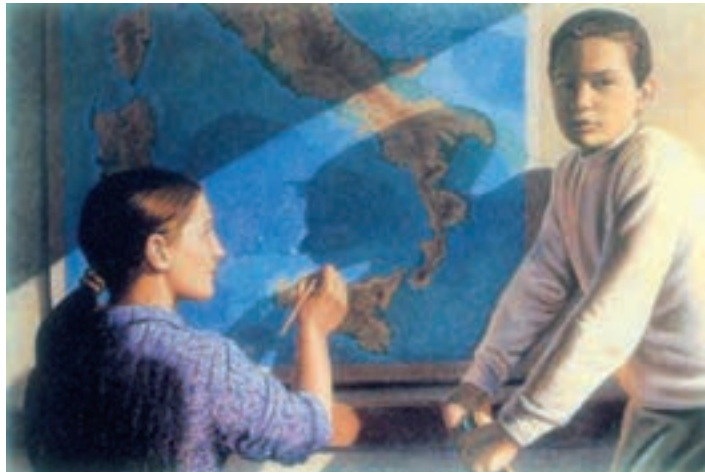
تصویر ۲۰- ریشه نقاشی، اثر کارلو برتوچی، بازگشت به سنت‌های کلاسیک، ۲۰۰۰، رنگ روغن روی بوم، ۸۰×۱۲۰، گالری پولیتیکو، رم