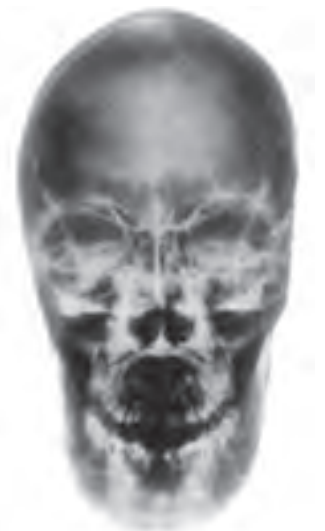
تصویر ۱۹- پرتره جمجمه، اثر الکساندر دوکادنه، ۱۹۹۹، چاپ سیباکروم روی آلومینیوم، هنر عکس، ۱۴۸ × ۲۵۰

در مقابل این شکل‌های جدید هنری، نوعی بازگشت به موضوعات و ارزش‌های کلاسیک به وجود آمده است که به جای پافشاری بر ژولیدگی زندگی شهری معاصر، تلاش دارند ارزش‌های کلاسیک را در آثارشان ارائه دهند. برتوچی در اثر خود (تصویر ۲۰) دو نوجوان ایتالیایی را با پس‌زمینه نقشه ایتالیا نشان می‌دهد تا بازگشتی به سنت‌های کلاسیک روم باستان باشد.