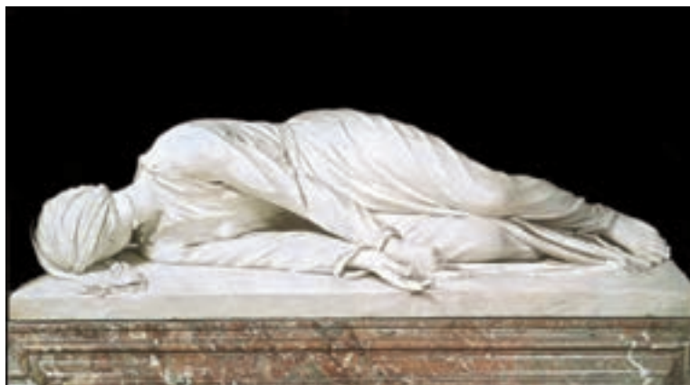
تصویر ۵- تندیس بدن روحانی متوفی (طبیعت‌گرایی پُر احساس)، اثر استفانو مادرنو، مرمر، حدود ۱۶۰۰ میلادی، روم