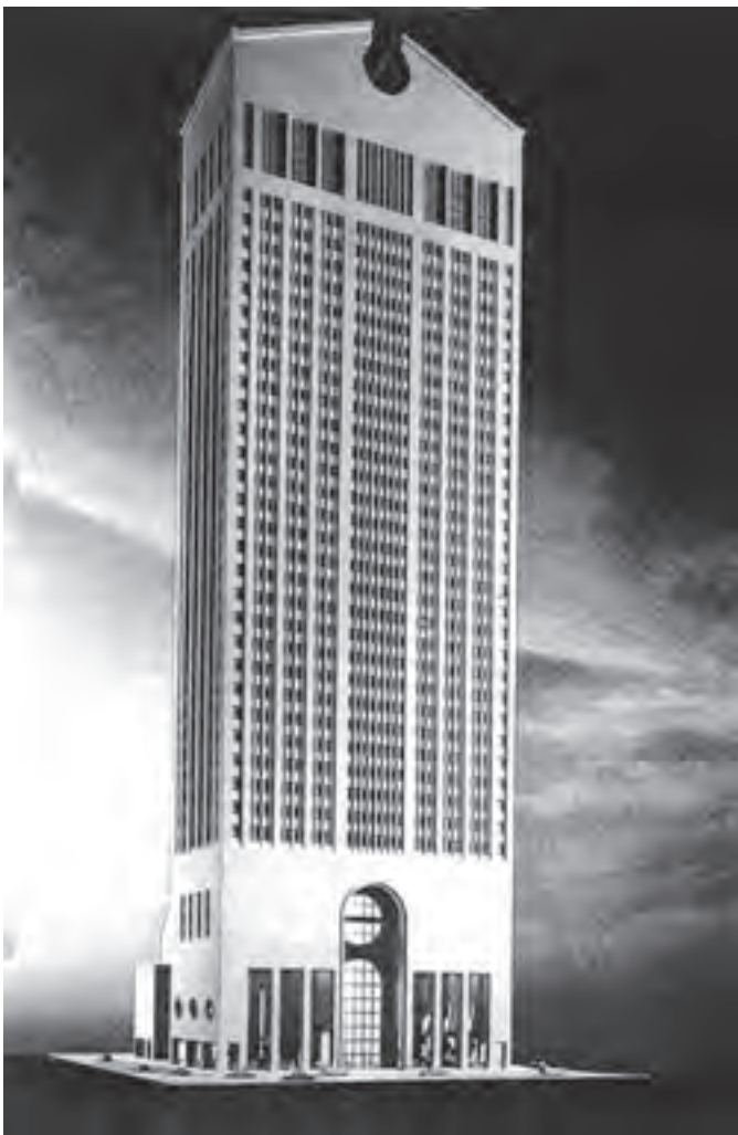
تصویر ۱۶- معماری پست مدرن، ساختمان سونی، اثر فیلیپ جانسون ۱۹۸۳، نیویورک (یادآور کمد قدیمی)