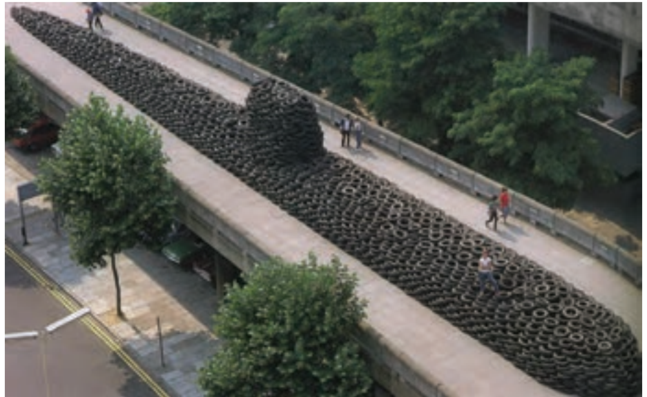
تصویر ۱۷- هنر چیدمان، اثر دیوید ماچ، لاستیک‌های فرسوده، نمایش در گالری هاروارد لندن، تخریب پس از نمایش

نام جوم پایک ۱ هنرمندی است که با چیدمان وسایل بصری، حجم‌های جالبی را ایجاد می‌کند و با نگاه طنز یا انتقادی خود، تسلط وسایل ارتباط جمعی را بر زندگی انسان نشان می‌دهد (تصویر ۱۸). در هنر معاصر، عکاسی جایگاه ویژه‌ای یافته است و هم ارزش با سایر رشته‌های هنری قرار گرفته است. به کمک امکانات کامپیوتری بین هنر عکاسی و دیگر شکل‌ها حد و مرزی وجود ندارد. دو رسانه ویدئو و عکاسی به دلیل جذابیت مردمی و جنبه سرگرمی و سهولت نقل و انتقال آن مورد استقبال هنر جدید قرار گرفته است. یکی از هنرمندان پُست مدرن در عکاسی، دوکادنه ۲ است که عکس‌های رادیولوژی را با توجه به ویژگی‌های شخصی افراد رنگ می‌زند و ترکیبی از عکاسی و نقاشی به وجود آورده است. (تصویر ۱۹).