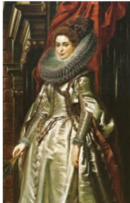
تصویر ۳- مارکزا، اثر روبنس، رنگ و روغن، سال ۱۶۰۶ میلادی، گالری هنر واشنگتن