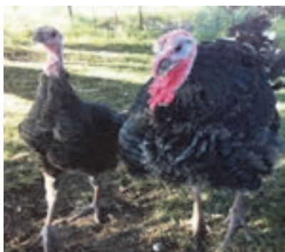
نژاد بوقلمون برنز