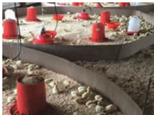
تغذیه جوجه‌ها با استفاده از انواع دانخوری