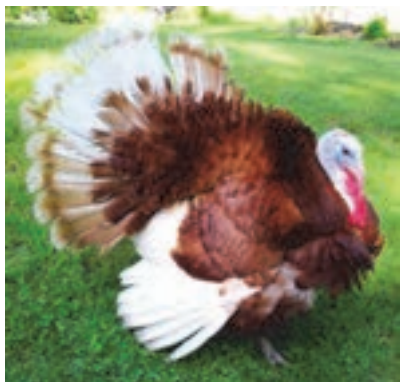
نژاد بوربن قرمز

دارای پر و بال سیاه و در سطح پرها دارای درخشندگی و انعکاس برنزی است. پرهای دم و بال دارای خطوط سفید است و از این رو راه راه به نظر می‌رسد. در حال حاضر دو نوع از بوقلمون‌های برنز وحشی و سینه پهن، بیشتر با مقاصد تجاری، تولید می‌شوند و دلیل آن این است که سینه آنها گوشت نسبتاً زیادی دارد. پرورش سینه پهن‌ها بسیار مشکل‌تر از نوع وحشی آنها است و دلیل آن این است که آنها به دلیل سینه پهن‌شان نمی‌توانند جفت‌گیری کنند و تکثیر آنها از طریق روش تلقیح مصنوعی صورت می‌گیرد.