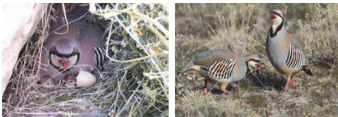
کبک چوکار یا معمولی

(سویه ایرانی) از ۵۰۰ تا ۸۰۰ گرم و وزن کبک ماده بالغ از ۴۵۰ تا ۶۸۰ گرم متغیر است. اندازه این پرنده ۳۰ تا ۳۵ سانتی‌متر می‌باشد که اندازه پرنده نر بزرگ‌تر است. ترکیب پرها در هر دو جنس نر و ماده یکسان است. رنگ این پرنده قهوه‌ای مایل به خاکستری در بالای بدن و زرد کم‌رنگ در قسمت شکم است. منقار، لبه پلک‌ها، ساق و پاهای کبک بومی ایران به رنگ صورتی تا قرمز تیره هستند. وجود یک سیخک کوچک در قوزک پا معمولاً از مشخصات جنس نر این پرنده است. کبک‌های نابالغ به رنگ قهوه‌ای و خاکستری هستند.