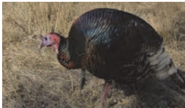
نژاد وحشی مکزیکی

این نژاد اجداد اولیه بوقلمون‌های امروزی است و از لحاظ رنگ بسیار شبیه به بوقلمون رنگ برنز می‌باشد؛ با این تفاوت که درخشندگی پرها و انعکاس نور در پرهای این نژاد بسیار زیباتر جلوه می‌کند. وزن آنها نسبتاً سبک‌تر از بوقلمون‌های معمولی است. بوقلمون‌های وحشی مکزیکی از چندین هزار سال قبل از میلاد مسیح در مکزیک و آمریکای شمالی وجود داشته‌اند. برخلاف بوقلمون‌های معمولی این نژاد می‌تواند در فاصله نزدیک به زمین با سرعت ۹۷ کیلومتر و به مسافت ۴۰۰ متر پرواز کند.