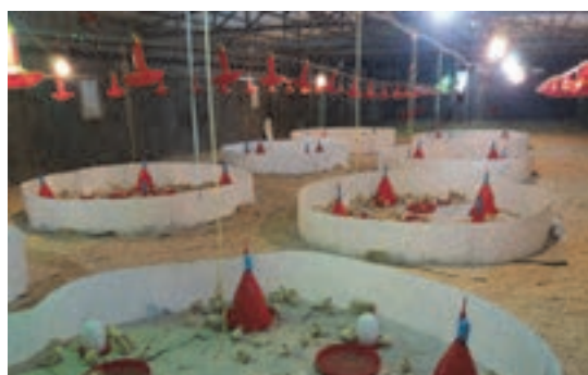
استفاده از دانخوری سینی و آبخوری کله قندی

دانخوری‌ها و آبخوری‌ها را به صورت مرتب تمیز و پر کنید. به تدریج دانخوری‌ها و آبخوری‌ها را با انواع بزرگ‌تر جایگزین کنید. این عمل در روز ۵ و ۶ پرورش انجام می‌شود.