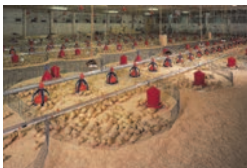
استفاده از دانخوری بشقابی و آبخوری خودکار

جدول زیر را تکمیل کنید و در کلاس درس گزارش دهید.