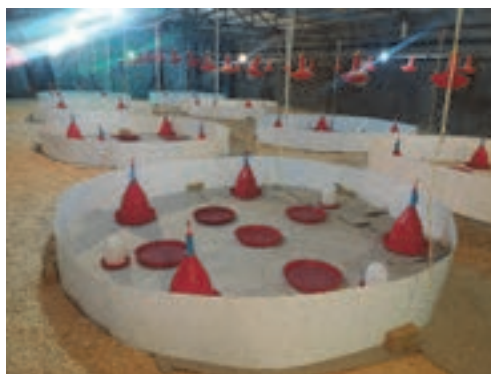
سالن قبل جوجه‌ریزی