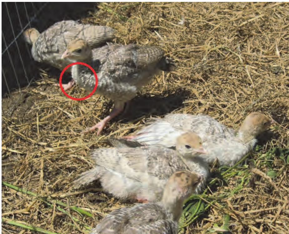
بررسی چین‌دان جوجه‌ها