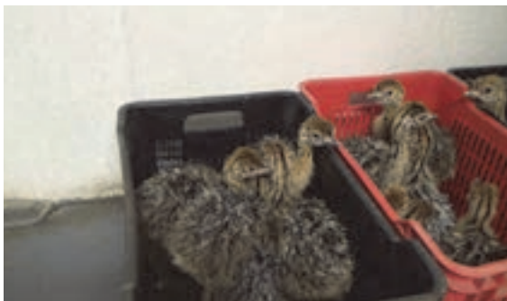
جوجه یک‌روزه شترمرغ