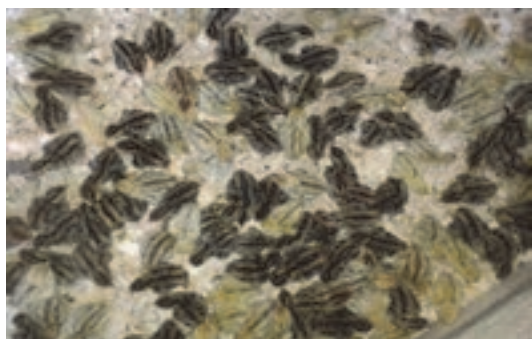
جوجه یک‌روزه بلدرچین