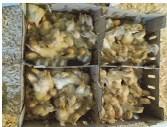
جوجه بوقلمون آماده حمل