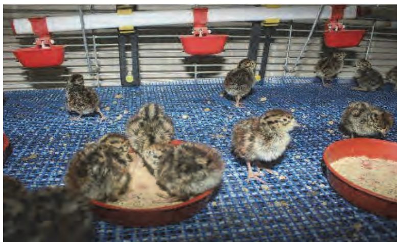
تغذیه جوجه‌های کبک در داخل قفس

جوجه کبک باید تغذیه نخستین خود را با درصد بالایی از پروتئین (حدود ۲۴ درصد) آغاز کند. نوع جیره غذایی آن مشابه جیره مرغ گوشتی است. کبک به صداهای شدید بسیار حساس است. کارهای مربوط به تغذیه و نظافت باید حتی الامکان سریع و بدون سر و صدا صورت گیرد.