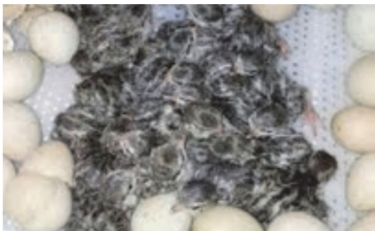
جوجه یک‌روزه کبک