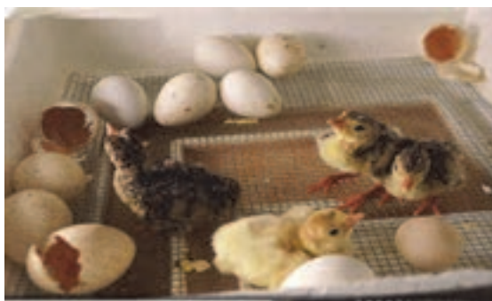
جوجه یک‌روزه بوقلمون