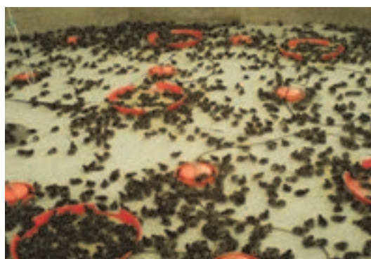
تغذیه جوجه‌های بلدرچین با استفاده از دانخوری سینی شکل و استوانه‌ای

دانخوری‌ها و آبخوری‌ها را به صورت مرتب تمیز و پر کنید. به تدریج دانخوری‌ها و آبخوری‌ها را با انواع بزرگ‌تر جایگزین کنید. این عمل در روز ۵ و ۶ پرورش انجام می‌شود.