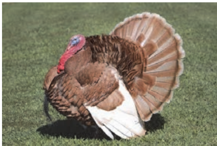
نژاد نیوجرسی نخودی

برای اولین بار در مؤسسه تحقیقاتی نیوجرسی توسط جرج کراندل تولید و پرورش داده شد. جثه آن کوچک بوده و رنگ پرها به جز پرهای سینه قرمز کم‌رنگ یا نخودی بوده و پرهای سینه در جنس نر دارای حاشیه‌های سفید و در جنس ماده دارای حاشیه‌های سیاه می‌باشد.