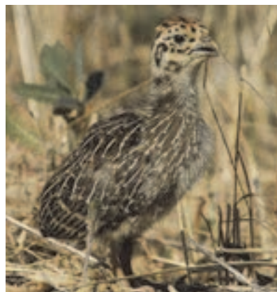
جوجه کبک چیل