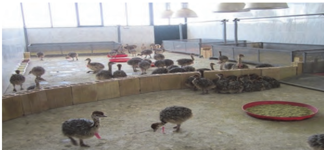
سالن پرورش جوجه شترمرغ

روزهای اول باید خوراک جوجه شترمرغ حدود ۲۳ درصد پروتئین داشته باشد. خوراک روزهای اول باید کاملاً خرد شده باشد، باید خوراک دادن را به جوجه‌ها آموخت، برای این کار بعضی از پرورش‌دهندگان چند جوجه با سن بالاتر را در گله می‌کنند.