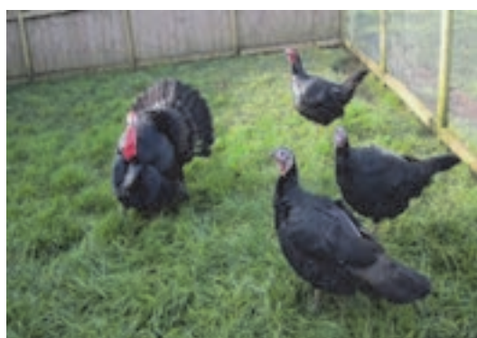
نژاد نورفلک سیاه

در این دسته فقط یک نژاد به نام نژاد نورفلک سیاه دیده می‌شود که در نورفلک انگلستان پرورش داده شده است. رنگ پر و بال در تمام بدن سیاه با انعکاس سبز است و در برخی لکه‌های سفید در پرهای بال و دم دیده می‌شود. رنگ پا سیاه کم رنگ است.