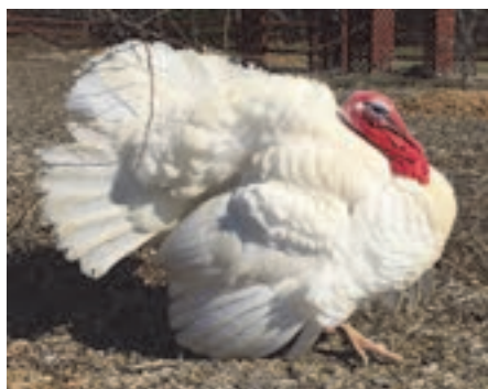
نژاد سفید هلندی

این نژاد که به اسامی دیگر مانند اتریشی و سفید هلندی نیز معروف است. برای اولین بار توسط مهاجرین هلندی به آمریکا برده شد و بعد از جنگ دوم جهانی پرورش آن توسعه زیادی یافت. رنگ ساق پا در این نژاد صورتی است. تعداد تخم سالیانه در این نژاد حدود ۶۰ تا ۷۰ عدد می‌باشد.