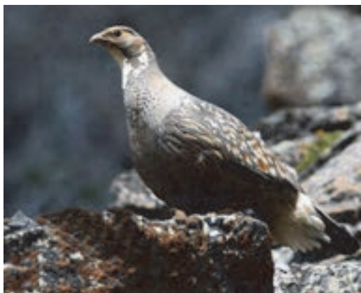
کبک بالغ چیل

طول بدن کبک چیل ۳۰ سانتی‌متر است، این پرنده مانند همه کبک‌ها دارای بدنی نسبتاً گرد و فربه است، بال‌های کوتاه و گرد و دم کوتاه خرمایی رنگ دارد، به وسیله صورت بلوطی مایل به نارنجی کم‌رنگ، گردن و سینه خاکستری مشخص می‌شود. پرنده نر علامتی نعلی شکل به رنگ بلوطی سیر در پایین سینه دارد.