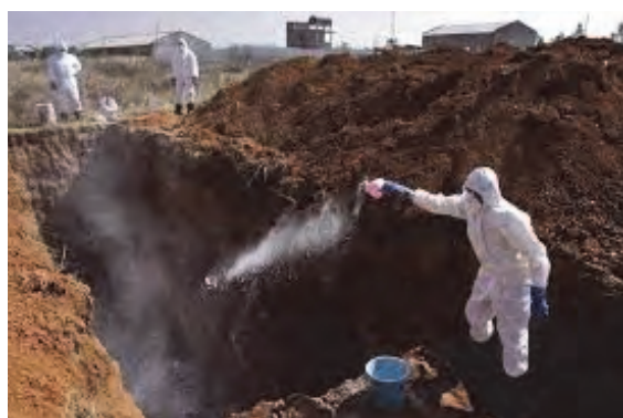
دفن کردن در چاله‌های عمیق