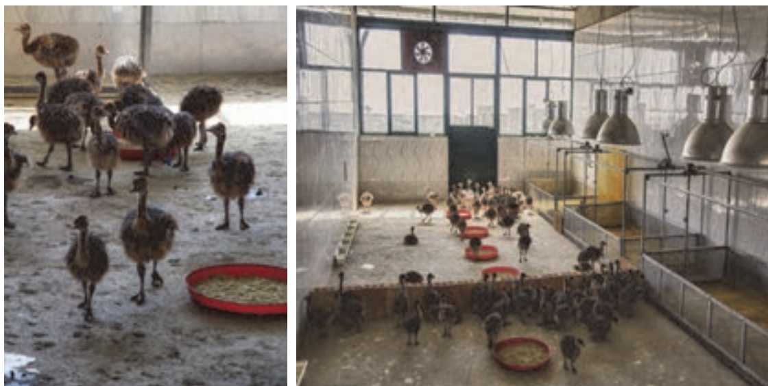
دسترسی به آب و خوراک از روز اول پرورش