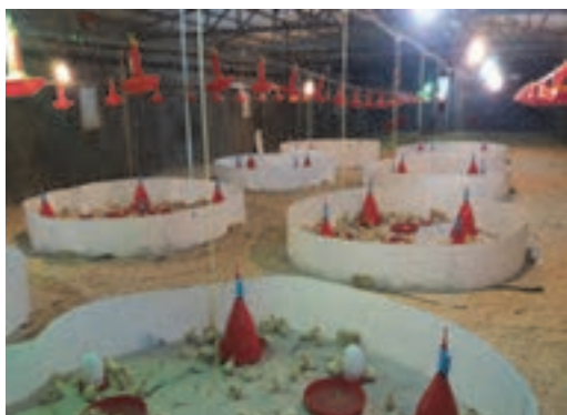
سالن بعد جوجه‌ریزی