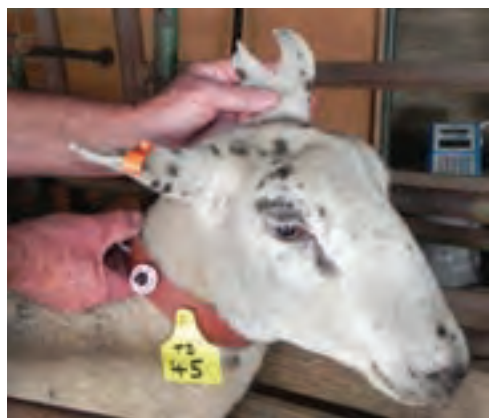
استفاده از پلاک گردن

مخصوص به خود هستند که رنگ آنها به آسانی از بین نخواهد رفت و دوام بسیار خوبی دارند، همچنین به منظور تفکیک سنی، جنسیتی و نژاد دام، دامدار می‌تواند از پلاک‌هایی با رنگ‌های متفاوت استفاده کند.