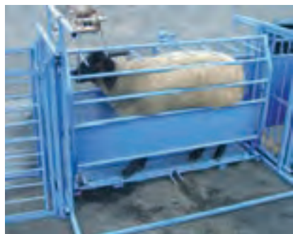
استفاده از نرده و جایگاه انفرادی