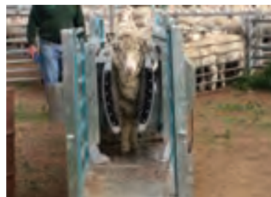
دستگاه مهارکننده ثابت (ایموبایزر) ۱