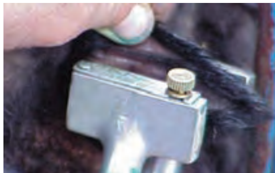
دستگاه خال کوب با حروف الفبایی

برای خال کوبی بره و بزغاله‌ها، حداقل باید تا سن ۵ یا ۶ ماهگی صبر کرد. در این سن جای کافی برای نصب شماره‌ها در گوش وجود دارد و گوش به اندازه کافی رشد کرده است. اگر دام را در سنین بسیار پایین خال کوبی کنید با رشد گوش اثر خال کوبی به تدریج محو می‌شود. به علاوه ضخیم شدن تدریجی بافت‌های گوش و افزایش مقدار مواد رنگی پوست، خال کوبی را غیر قابل خواندن می‌کند.