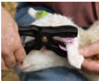
نحوه مهار بره با دست

در زیر برخی از روش‌های مهار کردن گوسفند و بز نشان داده شده است.