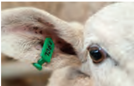
استفاده از پلاک گوش پلاستیکی