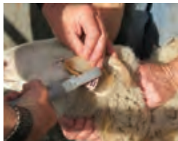
نحوه مهار گوسفند با دست