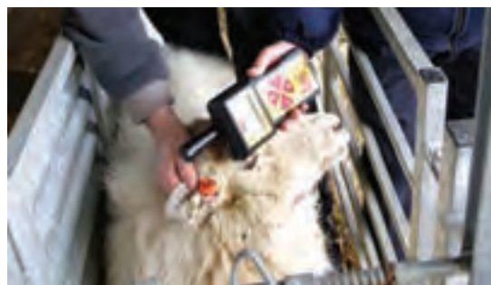
استفاده از میکروچیپ در گوش گوسفند

خمیر قلیایی توسط یک مهر لاستیکی روی پوست خشک قرار داده می‌شود. این روش باعث ایجاد فرورفتگی بدون مو می‌شود. در چند روز اول پس از استعمال، باید حیوان را از باران و رطوبت محافظت نمود.