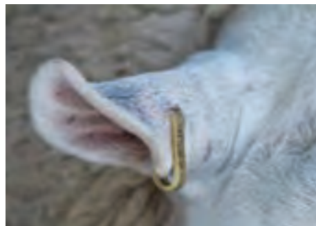
استفاده از پلاک گوش فلزی