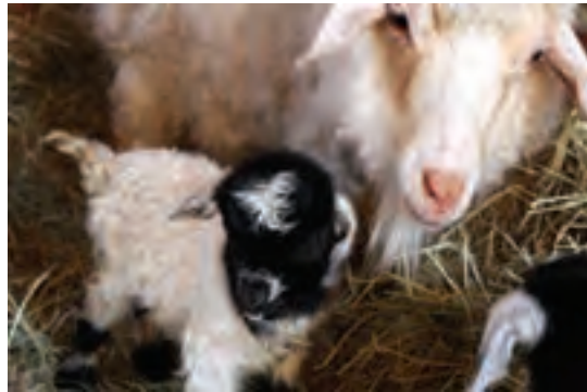
استفاده از اثر بینی در شناسایی دام