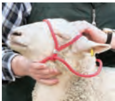
طناب برای مهار کردن گوسفند و بز