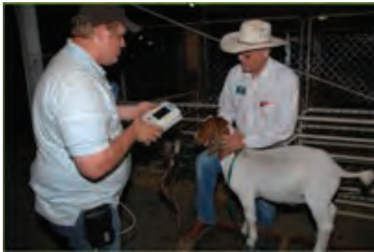
استفاده از اسکن شبکیه چشم در بز