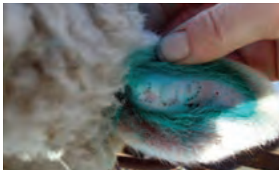
گوش خال کوبی شده

خال کوبی روی سطح داخلی و یا خارجی گوش به وسیله پلاک کوب مخصوص خال کوبی (انبر خال کوبی) انجام می‌شود. این پلاک کوب دارای حروف و ارقام تغییرپذیر هستند و به شکل سوزن‌های نوک تیز می‌باشند. اعداد سوزنی شکل در پلاک کوب مخصوص خال کوبی قرار داده می‌شود و مخاط داخلی گوش توسط آنها سوراخ می‌شود. سوراخ‌های ایجاد شده به شکل شماره یا علامت مورد نظر ظاهر می‌شود. سپس جوهر مخصوص روی آنها مالیده می‌شود. پس از چند روز جای سوزن‌ها بهبود می‌یابد و جوهر در زیر پوست به صورت نقاط رنگی باقی می‌ماند و شماره دام با استفاده از جوهر به کار رفته قابل خواندن خواهد بود. در مقایسه با سایر روش‌های علامت‌گذاری، خال کوبی نسبتاً پرهزینه است؛ اما اگر به درستی انجام شود تا آخر عمر حیوان، اثر آن باقی می‌ماند. ولی حیواناتی که پوست گوش آنها سیاه‌رنگ است، نقش خال آنها واضح نیست.