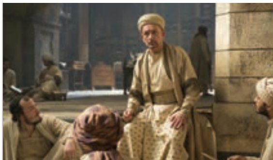
تحریف وقایع در فیلم‌های هالیوودی نمونه‌ای از بی‌اخلاقی رسانه‌ای

به اعتقاد بیشتر صاحب‌نظران حوزه رسانه، اخلاق رسانه‌ای اگرچه تابع اصول و قواعدی کلی و جهان‌شمول است، به سبب ریشه داشتن آن در مجموعه ارزش‌های درون جامعه، می‌تواند از جامعه و فرهنگی به جامعه و فرهنگ دیگر متفاوت و متغیّر باشد. از این رو تدوین اصول کلی اخلاق رسانه‌ای در هر فرهنگ و جامعه، تعاریف و محدوده‌های خاص خود را دارد.