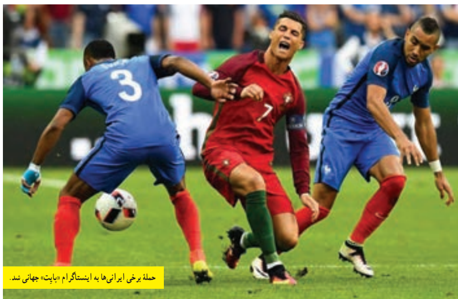
حمله برخی ایرانی‌ها به اینستاگرام «بایت» جهانی شد.