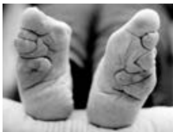
پاهای زنان چینی در گذشته