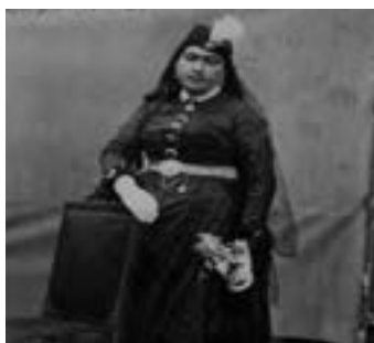
انیس الدوله همسر ناصرالدین‌شاه