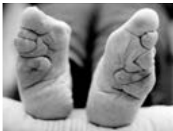
پاهای زنان چینی در گذشته