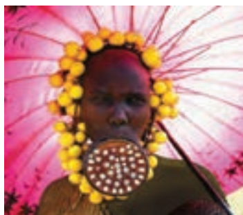
زنی از قبیله مرسی در اتیوپی

امروزه ما در دوره‌ای زندگی می‌کنیم که لاغر بودن به مهم‌ترین ویژگی پسند افراد تبدیل شده است و اکثر ما می‌خواهیم لاغر باشیم. در واقع تا قبل از سن شش سالگی کودکان از طریق پیام‌های تصویری یاد می‌گیرند که افراد چاق را به‌عنوان افراد زشت، تنبل، ناسالم، و... بشناسند. از تصاویر موجود می‌توان به معیارهای زیبایی در فرهنگ‌ها و دوره‌های تاریخی پیشین پی برد. این تصاویر نشان می‌دهند که زیبایی در آن فرهنگ و دوره چگونه بوده است. آرمان‌ها دربارهٔ زیبایی بر اساس توافقات اجتماعی ساخته می‌شود. به عنوان مثال، تصویر زنان زمان قاجار و تصاویر بستن پاهای دختران چینی با قالب چوبی در کودکی (برای کوچک ماندن پا و قدم کوتاه برداشتن)، نشان می‌دهد که چطور در قرون گذشته و در فرهنگ‌های مختلف معیارهای زیبایی متفاوت بوده است. زنان در مقابله با این فشار برای لاغر شدن از طریق رژیم گرفتن، واکنش نشان می‌دهند. بیشتر این رژیم‌ها برای حفظ ظاهر است تا سلامتی. درصد بالایی از افراد شکل بدن خود را دوست ندارند و رژیم گرفتن برای همهٔ سنین از نه سالگی تا کهنسالی به یک دغدغه تبدیل شده است. شگفت‌انگیز نیست که به این افراد مشاوره داده می‌شود که برای غذا خوردن احساس گناه کنند. پژوهشی نشان می‌دهد که در طول یک دهه تعداد مقالات در مورد رژیم گرفتن نسبت به دهه قبل دو برابر شده است و این نکته مهم است که رژیم گرفتن و ورزش نه با هدف سلامتی که با هدف زیبایی انجام می‌شود و سلامتی فقط به آن مشروعیت می‌دهد.