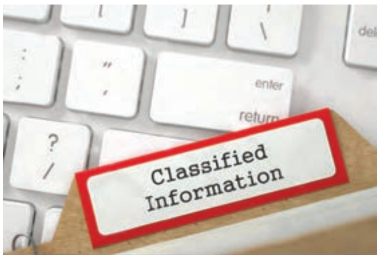
شکل ۸-۱۰ ثبت اطلاعات

امروزه نرم‌افزارهای پذیرش مختلفی طراحی و ارائه شده‌اند تا تمامی اطلاعات مشتری و کالا یا سفارش پذیرش شده پس از ثبت دستی در رایانه ثبت و قابل بررسی و استخراج باشند، شکل ۸-۱۰. به این ترتیب فرایند بررسی سوابق براساس نام مشتری، شماره سریال و موارد مشابه آن با صرف زمان کمتری قابل دسترسی است. به این ترتیب اطلاعات را می‌توان به صورت غیرحضوری از مشتری دریافت و در رایانه ثبت نمود، یا به صورت آنلاین و اینترنتی اطلاعات را از مشتری دریافت کرد.