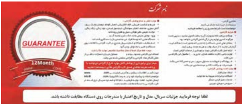
شکل ۸-۸ کارت گارانتی

احتمالاً بارها عبارات گارانتی و وارانتی را از فروشنده‌های مختلف شنیده‌اید یا نام آنها را روی محصولات مختلف دیده‌اید، شکل ۸-۸ یک نمونه واقعی برکه گارانتی را نشان می‌دهد. کلمات گارانتی و وارانتی علاوه بر شباهت اسمی دارای عملکردی شبیه به هم هستند اما تفاوت بزرگی نیز دارند. برخی از محصولات به دلخواه فروشنده و تولیدکننده دارای گارانتی یا وارانتی و یا هر دوی آنها هستند تا اطمینان مشتری را بیشتر جلب کنند. گارانتی در واقع قولی است که فروشنده یا تولیدکننده به عنوان ضمانت کیفیت کالای تولید شده یا مورد فروش به مشتری می‌دهد، تا اگر شرایط خاصی اتفاق افتاد این قول عملی شود. وقتی شما محصولی را خریداری می‌کنید که دارای گارانتی است، به این معنی است که تا زمان مشخصی محصول شما بایستی به درستی کار کند و در صورت خرابی، اصل پول به شما بازگردانده می‌شود و یا محصول خراب با یک محصول مشابه نو و سالم جایگزین می‌گردد.