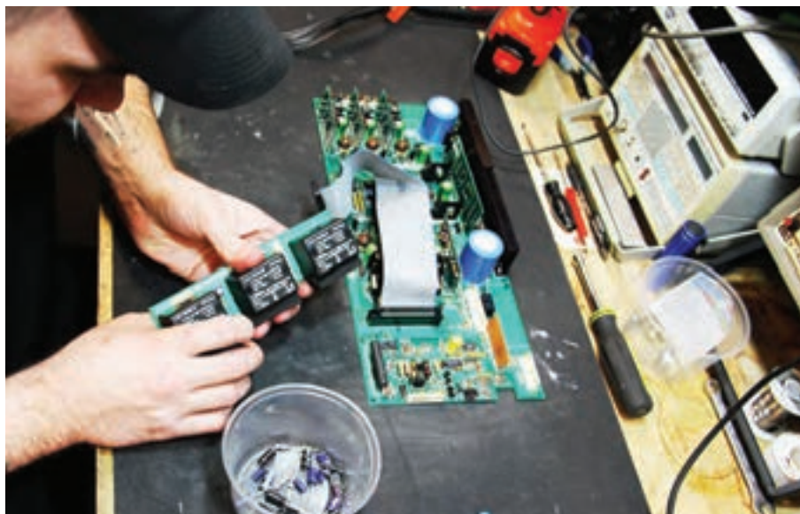
شکل ۶-۸ تعمیر برد الکترونیک

شکل ۷-۸ یک نمونه ساده برگ خروج کالا از انبار را نمایش می‌دهد. این فرم می‌تواند محلی برای ذکر نام یا کد تعمیرکار درخواست‌کننده و امضای وی و مدیر تعمیرگاه را داشته باشد.