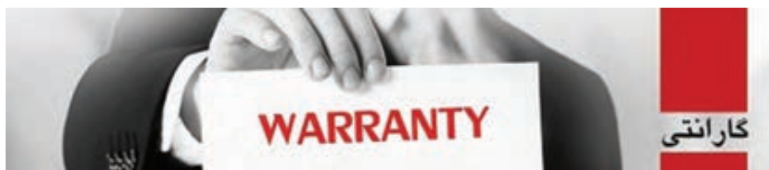
شکل ۹-۸ کارت وارانتی

دوره وارانتی طولانی‌تر از زمان گارانتی است. به این معنی که محصول در دوره بیشتری استفاده می‌شود ولی در آن بازگشت دستگاه و دریافت پول از فروشنده وجود ندارد، شکل ۹-۸. در وارانتی، محصول در زمان مشخصی که بیشتر از دوره گارانتی است با همان مشخصات اولیه تضمین می‌شود. همچنین اگر در این زمان محصول با مشکلی روبرو شد هزینه تعمیر و تعویض قطعات به عهده فروشنده و ارائه دهنده خدمات است.