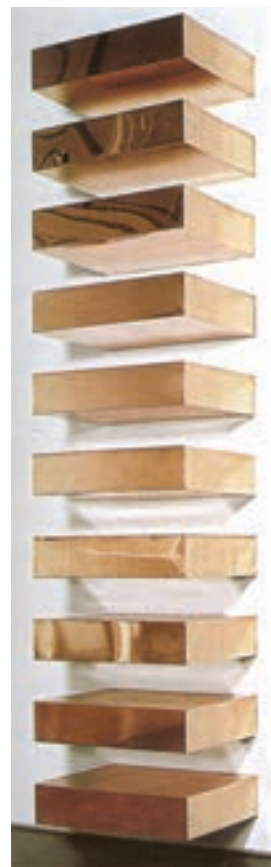
تصویر ۱۴- بدون عنوان، اثر دانالد جاد (Judd)، ۱۹۶۵، فلز، مینیمال گالری لئوکاستلی، نیویورک، آمریکا

از سال‌های ۱۹۶۰ به بعد در آمریکا جنبش پاپ جای خود را به دو جریان مینیمالیسم و هنر مفهومی داد. اساس هنر مینیمال، خلاصه‌گرایی در فرم و تأکید بر محتوا در نقاشی و تندیس‌سازی است و پیش از آنکه به احساسات شخصی و بیان آنها علاقمند باشد، سعی دارد از قوانین فیزیک، ریاضی، طراحی صنعتی، استعاره و نشانه در خلق آثار استفاده کند (تصویر ۱۴). هنر مفهومی از اواخر دهه ۶۰، پس از مینیمال آرت پدید آمد و سرآغاز پست مدرنیسم بود. این جریان هنری در ارتباط با آثار سه بعدی آغاز شد و هدف آن توضیح مجدد مسائلی چون فضا، فرم، مقیاس و محدوده بود. در هنر مفهومی، مفهوم یا ایده اثر بر زیبایی‌شناسی و مواد به کار رفته در آن اولویت دارد. به عقیده هنرمندان این جریان هنری، اثر هنری، یک شیء فیزیکی نیست، بلکه دارای مفهوم و ایده است و حتی از عکس، نقشه، نمودار، نوار صوتی، ویدئو و غیره به‌عنوان رسانه نیز استفاده می‌شود. نمونه مشخص هنر مفهومی یک صندلی و سه صندلی اثر کازوت است. این اثر شامل یک صندلی واقعی، تعریف صندلی و عکس آن صندلی بر دیوار است، که هر کدام می‌توانند بیانگر مفهوم صندلی