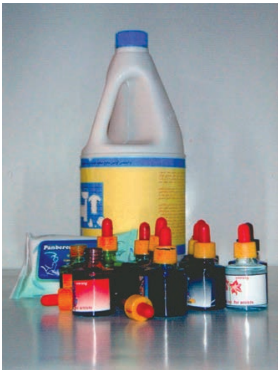
▲ تصویر ۵۴- در تصویر وسایل مورد نیاز شیوه جوهرهای رنگی و پاک کننده (سفیدکننده) دیده می شود

جوهرهای رنگی، دستمال کاغذی، پاک کننده، قلم موی الیاف مصنوعی و یا چوب کبریت (تصویر ۵۴).