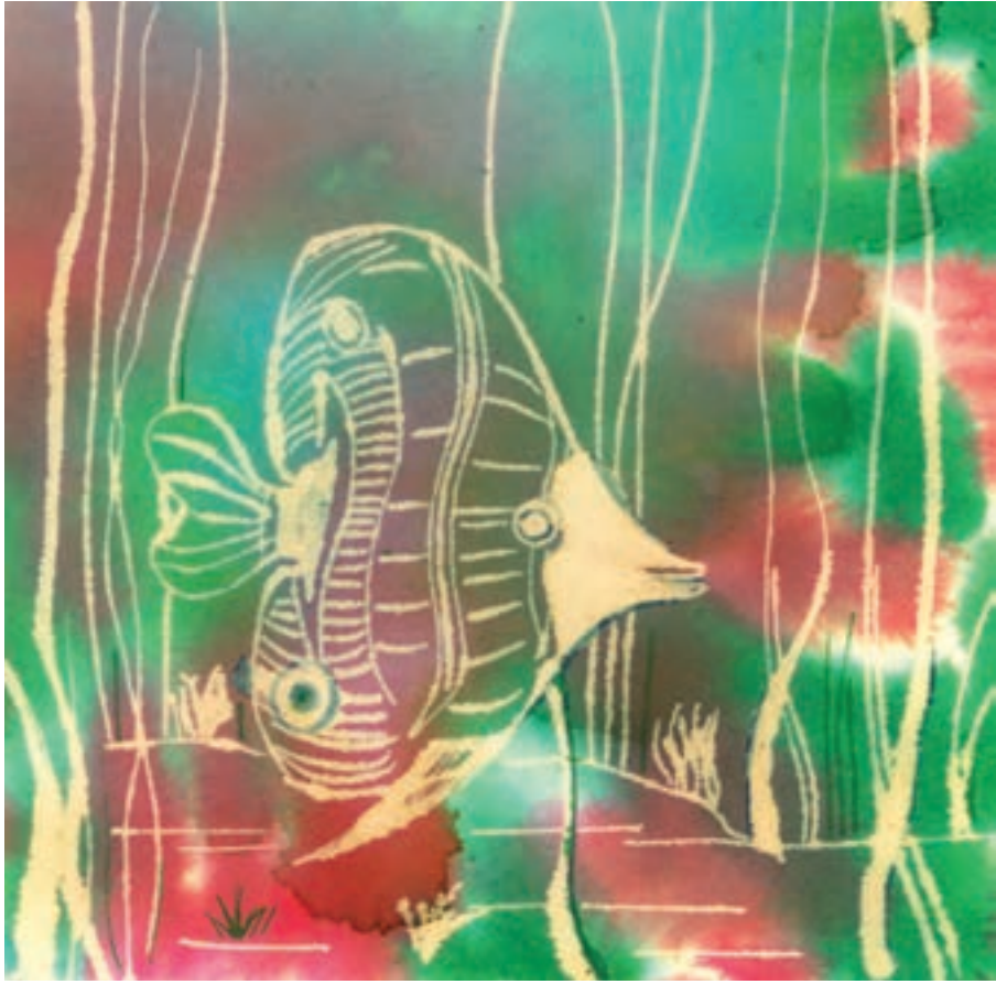
▲ تصویر ۵۷-ج - اثر دانشجو مهناز سیداختیاری