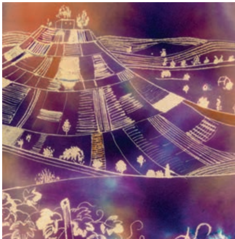
▲ تصویر ۵۷- ب - اثر دانشجو مهناز سیداختیاری