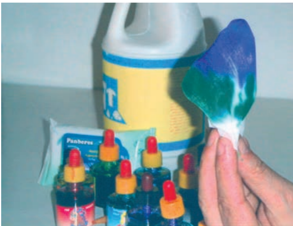
▲ تصویر ۵۶- الف - نشان دهنده مرحله دوم رنگ آمیزی با جوهرهای رنگی و پاک کننده است.