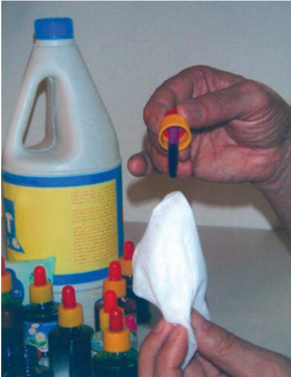
▲ تصویر ۵۵ - تصویر نشان دهنده مرحله اول شیوه جوهرهای رنگی و پاک‌کننده است که با قطره‌چکان بر دستمال کاغذی مرطوب اکولین می‌چکانیم

در این شیوه ابتدا دستمال کاغذی را با آب مرطوب می‌کنیم. سپس با استفاده از قطره‌چکان چند قطره از رنگ دلخواه را همان‌گونه که در تصویر ۵۵ مشاهده می‌کنیم بر روی دستمال کاغذی مرطوب که چند تا خورده می‌چکانیم. و با توجه به خیس بودن سطح دستمال رنگ به راحتی و به صورت اتفاقی بر سطح دستمال پخش می‌شود. و با همین شیوه رنگ‌های دیگر را به آن اضافه می‌کنیم. نتیجه حاصله رنگ‌هایی با شکل‌های غیرمنتظره و زیبا می‌باشد (تصویر ۵۶- الف و ب). بعد از این که رنگ‌گذاری به اتمام رسید، تای دستمال را به دقت باز نموده و صبر می‌کنیم تا کاملاً خشک شود و سپس با پاک‌کننده (سفیدکننده) بر روی آن طرح مورد نظر خود را اجرا می‌کنیم (تصویر ۵۶- الف تا ج). و طرح به صورت خطوط نگاتیو (سفید) بر سطح دستمال کاغذی بوجود می‌آید و پاک‌کننده به خوبی رنگ را پاک می‌کند.