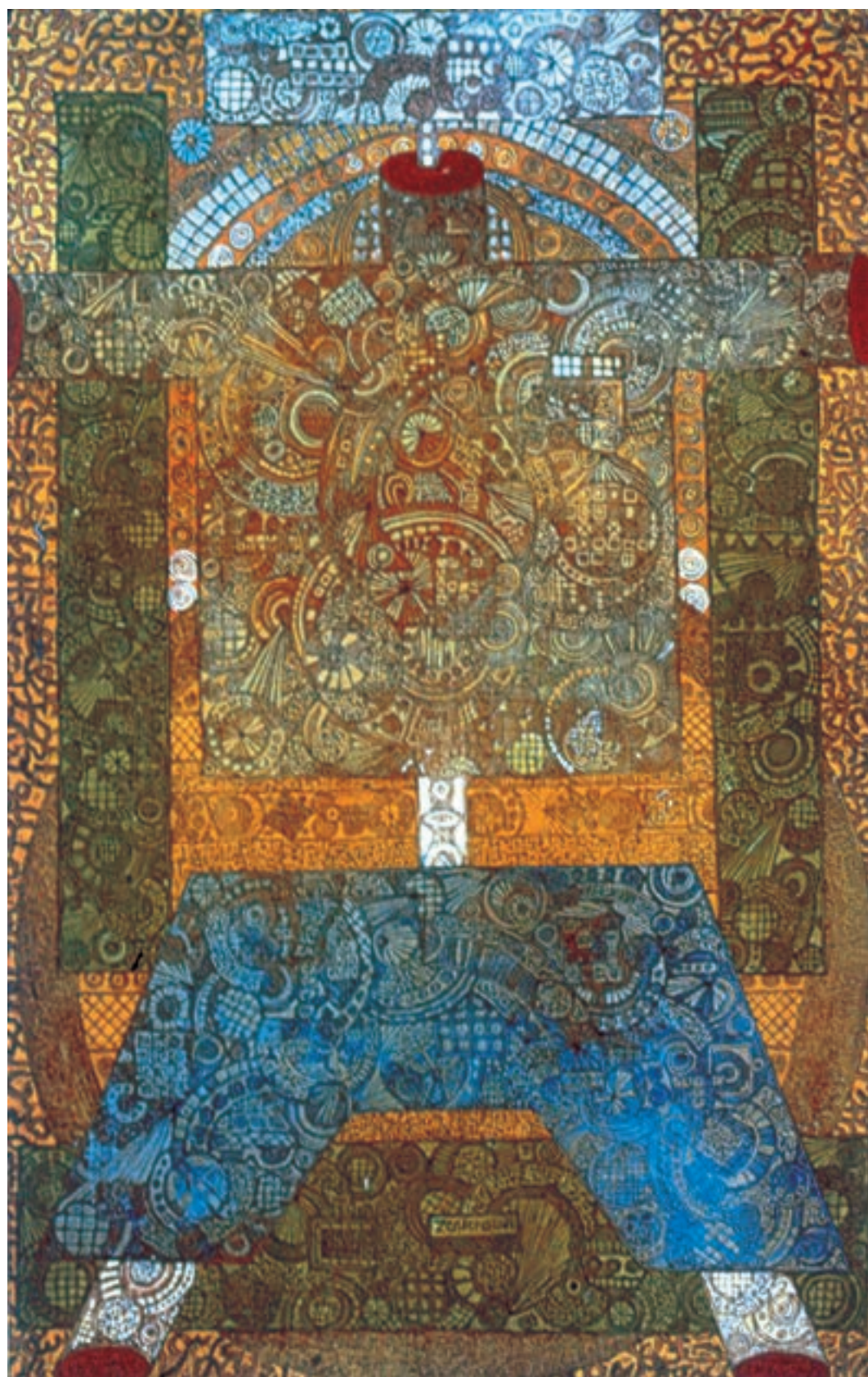
تصویر ۷۷-۲. بدون عنوان، اثر حسین زنده رودی