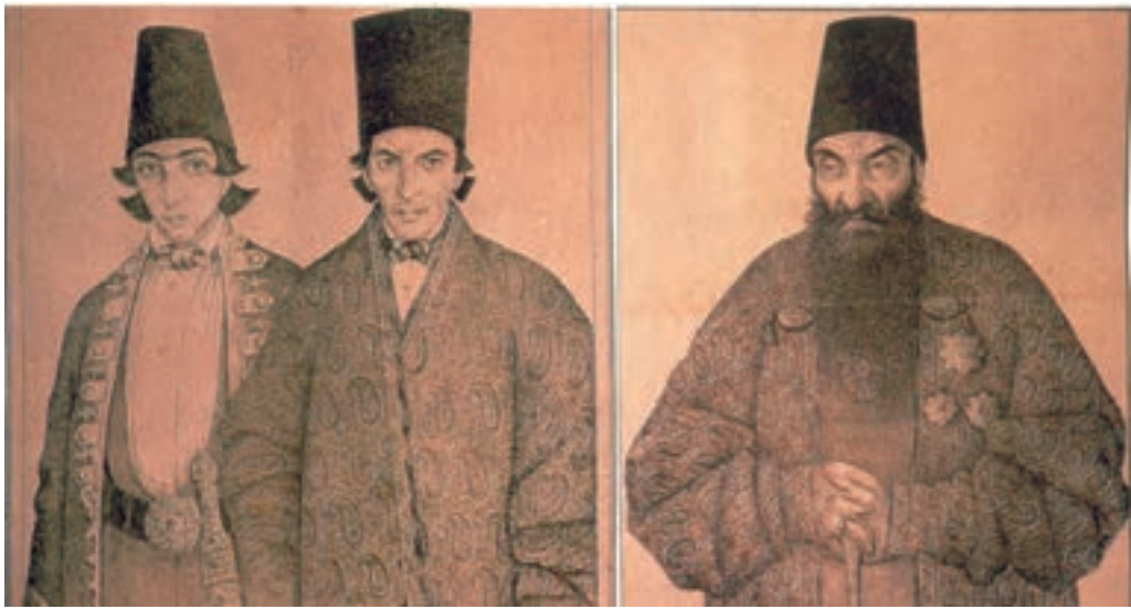
تصویر ۵۹-۲- طراحی از چهره برای چاپ در روزنامه، اثر صنیع الملک.