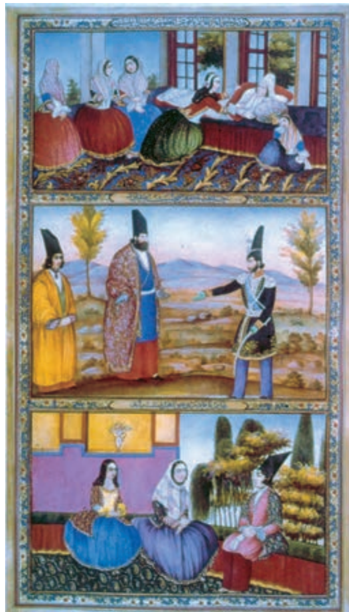
تصویر ۶۰-۲- برگي از کتاب هزار و یک شب، اثر صنیع الملک، آب رنگ روی کاغذ ۱۲۷۵ هـ. ق.