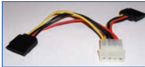
شکل ۴-۷ کابل‌های منبع تغذیه

منبع تغذیه سطح ولتاژهای متفاوت ۳/۳، ۵ و ۱۲ ولت را تولید می‌کند که سطح ولتاژ ۳/۳ و ۵ ولت، جهت استفاده مدارهای منطقی و سطح ولتاژ ۱۲ ولت برای راه‌اندازی موتورهای دیسک‌گردان‌ها و یا پروانه‌های خنک‌کننده استفاده می‌شود. با بالا رفتن مصرف برق پردازنده‌های چند هسته‌ای و کارت‌های گرافیک، نیاز سیستم‌های امروزی به خروجی ۱۲ ولتی بیشتر شده است. به همین دلیل در هنگام تهیه منبع تغذیه باید توجه داشت که خروجی ۱۲ ولت آن بیشترین توان را داشته باشد. استفاده زیاد از خروجی‌های ۵ و ۳/۳ ولتی در سیستم‌های مدرن که دارای پردازنده‌های چند هسته‌ای و چند کارت گرافیک هستند باعث کاهش توانایی منبع تغذیه در تأمین برق مورد نیاز اجزای اصلی می‌شود که عموماً از خروجی‌های ۱۲ ولتی تأمین می‌شوند.