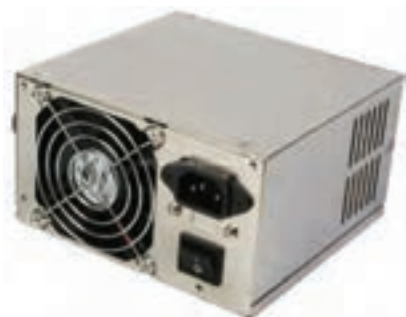
شکل ۳-۷ منبع تغذیه