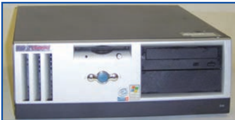
شکل ۷-۱ کیس رومیزی

این نوع کیس به صورت افقی است (شکل ۷-۱) و بر روی میز قرار می گیرد و به طور معمول صفحه نمایش را روی آن قرار می دهند. امروزه از این نوع کیس ها خیلی کم استفاده می شود.