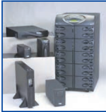
شکل ۶-۷ دستگاه‌های مختلف برای تأمین برق بی‌وقفه