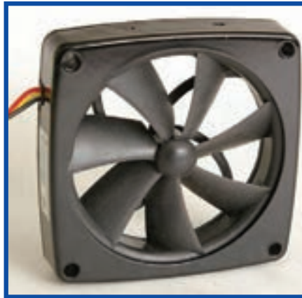
شکل ۷-۷ پروانه خنک‌کننده

برای خنک کردن منبع تغذیه ATX، پروانه خنک‌کننده آن، هوای داخل کیس را به داخل منبع تغذیه کشیده و سپس به خارج از کیس می‌دمد. این عمل پروانه علاوه بر خنک کردن منبع تغذیه باعث گردش هوای داخل کیس و خنک شدن سایر قطعات سیستم نیز می‌شود. برای اطمینان از کنترل مناسب دمای قطعات داخل کیس افزون بر پروانه منبع تغذیه، پروانه‌های خنک‌کننده دیگری را می‌توان در سطوح بالایی یا جانبی کیس نصب کرد. تعداد پروانه‌های خنک‌کننده اضافی و ضرورت آن بستگی به محل نصب و پیکربندی رایانه از نظر نوع پردازنده و اجزای جانبی مانند دیسک گردان‌ها دارد. نمونه‌ای از پروانه خنک‌کننده در شکل ۷-۷ مشاهده می‌شود.