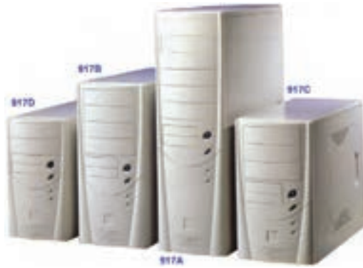
شکل ۲-۷ کیس‌های برجی در اندازه‌های مختلف

- برج کوچک ۱ : برای برد اصلی با فاکتور شکل MicroATX.