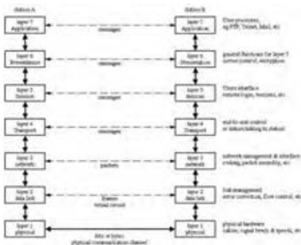
شکل ۱-۵- لایه‌ها در مدل OSI

نکته‌ای که در مورد لایه‌ها می‌توان به آن اشاره کرد این است که هر لایه فقط با لایه‌های قبلی، بعدی و لایه نظیر خود در رایانه مقصد ارتباط دارد. در سیستم مبدأ این لایه‌ها از بالا به پایین اطلاعات مورد نیاز لایه زیرین خود را فراهم می‌کنند و در سیستم مقصد از پایین به بالا، لایه‌ها اطلاعات مورد نیاز لایه بالایی را فراهم می‌کنند.