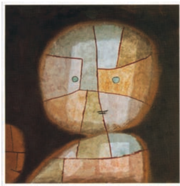
شکل ۱-۳- موانع خلاقیت

همان‌طور که در مورد عوامل مؤثر بر خلاقیت گفتیم موانع نیز می‌توانند درونی یا بیرونی باشند (شکل ۱-۳).