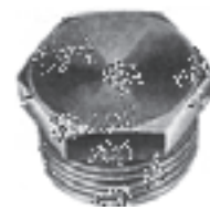
شکل ۸-۶- درپوش

جعبه تقسیم‌های چهارگوش: چون جعبه تقسیم‌های گرد حداکثر چهار راهه هستند، لذا در مسیری که تعداد لوله‌ها بیش‌تر باشد، از جعبه تقسیم چهارگوش استفاده می‌شود. سوراخ‌های این جعبه‌ها دارای رزوه نبوده و برای اتصال لوله به آن‌ها باید از بوشن و بوش برنجی استفاده کرد. شکل ۹-۶ چند نمونه جعبه تقسیم چهارگوش را نشان می‌دهد.