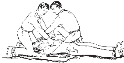
شکل ۱-۲- تنفس مصنوعی روش سیلوستر

ریه‌ی مصدوم خارج شود، بینی را رها کنید و به آرامی به قفسه‌ی سینه‌اش فشار آورید. این عمل را آنقدر تکرار کنید تا مصدوم بتواند نفس بکشد. تناوب دم و بازدم بایستی با تنفس شخص کمک‌دهنده هم زمان باشد (شکل ۱-۳).