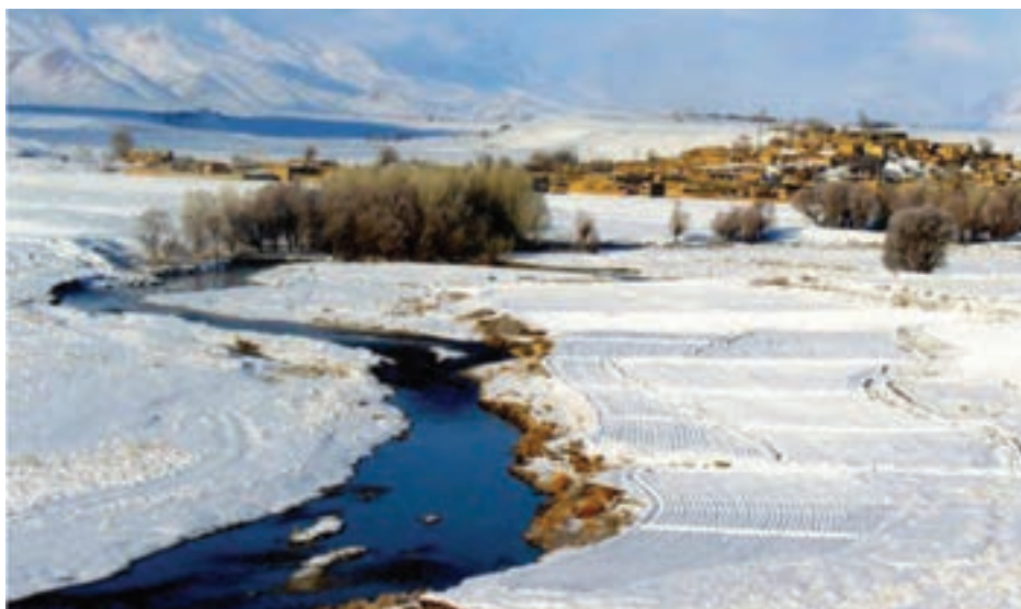
شکل ۱-۲- روستایی در فریدن

گفتنی است که وجود ۲۸ روستا به عنوان هدف گردشگری، تصویب ۶۰ منطقه نمونه گردشگری در توسعه گردشگری در استان اصفهان مؤثر بوده است. علاوه بر این، تعریف ۲۸ محور گردشگری، تولید نقشه ایران با محورهای گردشگری، حفظ و احیای رشته های صنایع دستی و ارائه سامانه اطلاعات مکانی آثار تاریخی و فرهنگی استان و طرح ملی تور الکترونیکی سبب افزایش گردشگران داخلی و خارجی در اصفهان شده است.