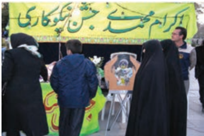
شکل ۲-۷- جشن نیکوکاری

عام‌المنفعه، خدمات خود را در جهت سه محور امور حمایتی از محرومان، امور توانمندسازی محرومان و امور اعتمادسازی و جلب مشارکت‌های مردمی دنبال می‌کند.