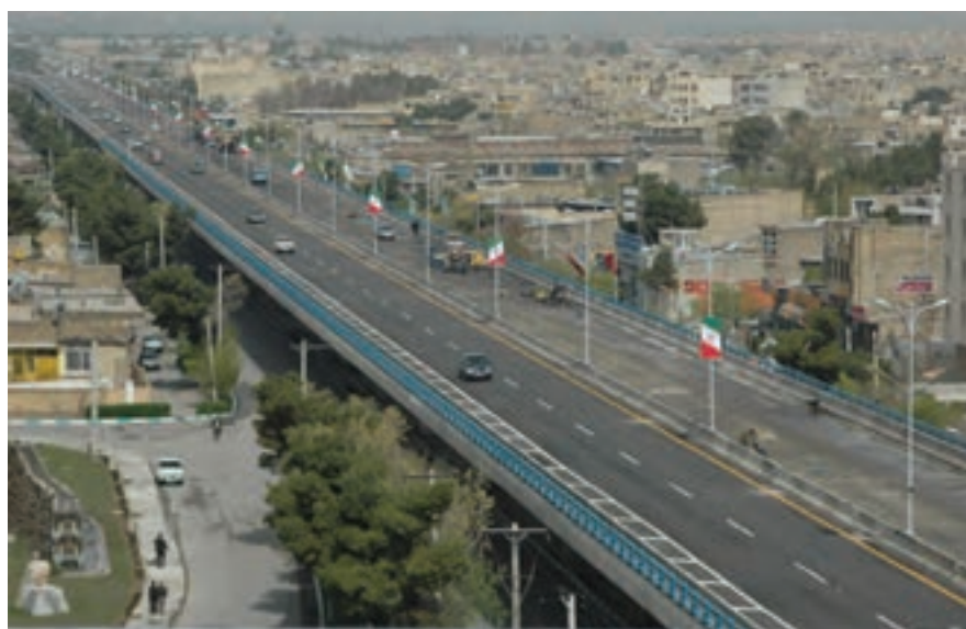
شکل ۳-۷- پل روگذر غیر مسطح امام خمینی (ره)

— حمل و نقل درون شهری : تا پایان شش ماهه اول سال ۱۳۸۷ سهم حمل و نقل عمومی در کلان‌شهر اصفهان ۶۸ درصد بوده است. طی ۳۰ سال (۸۵-۱۳۵۸) جمعیت شهری استان حدود ۲/۱۵ برابر شده؛ در حالی که تعداد وسایل حمل و نقل عمومی به بیش از ۵۹ برابر رسیده است.