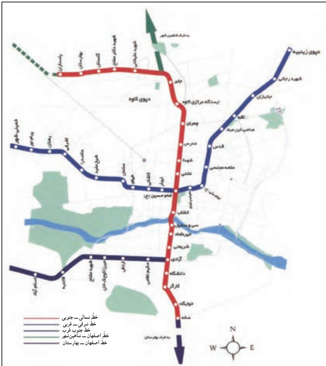
شکل ۴-۷- نقشه خطوط متروی شهر اصفهان