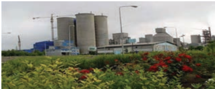
شکل ۱-۶- کارخانه سیمان آرتا اردبیل

پس از انقلاب شکوهمند اسلامی ایران نیز به‌علت مشکلات سیاسی مخصوصاً جنگ تحمیلی، تحول عمده‌ای در صنعت استان رخ نداد. اما پس از استان شدن اردبیل و با شروع برنامه اول توسعه اقتصادی، مسئولان منطقه در صدد توسعه صنعتی استان برآمدند و با تشکیل ادارات کل اقتصادی مخصوصاً اداره کل صنایع و معادن و شرکت شهرک‌های صنعتی، رغبت و علاقه برای سرمایه‌گذاری افزایش یافت به طوری که با راه‌اندازی واحدهای صنعتی بزرگ در کنار واحدهای صنعتی و معدنی کوچک، کارخانجاتی مانند: سیمان، لاستیک، خودرو، شیرخشک صنعتی، رنگ و ابزارآلات صنعتی، ریسندگی، پنبه پاک‌کنی، فولاد، نئوپان‌سازی، قطعات خودرو، ... احداث و به مرحله بهره‌برداری رسید.