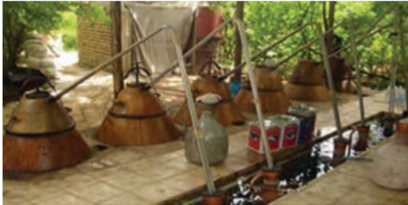
شکل ۱۰-۵- گلاب‌گیری (قمصر کاشان)

روز سیزده فروردین نیز مردم سبزه سفره هفت‌سین را از خانه بیرون می‌برند. این روز، روز بزرگداشت و احترام به طبیعت است و تا پایان روز، افراد خانواده و فامیل در کنار هم در دشت و سبزه‌زار ساعتی را می‌گذرانند. ج) مراسم گلاب‌گیری: گلاب‌گیری در قمصر، برزک، نیاسر، جوشقان و کاشان از قدمتی دیرینه برخوردار است که این، خود از رواج کاشت گل محمدی در این منطقه خیر می‌دهد و نسل به نسل از گذشتگان به فرزندان انتقال یافته است.