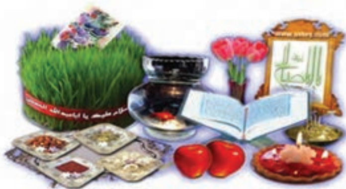
شکل ۹-۵- سفره هفت‌سین

ث) مراسم از عید نوروز تا سیزده نوروز : با پایان فصل سرما و آغاز بهار، مردم ما در تمام نقاط، جشن می‌گیرند. قبل از تحویل سال جدید، مراسم به اشکال و آداب مختلف انجام می‌گیرد؛ از آن جمله است : چهارشنبه‌سوری، قاشق‌زنی، خانه‌تکانی و سبزه سبز کردن. هنگام تحویل سال، اکثر مردم به زیارت امامزادگان و اهل قبور می‌روند و مشغول خواندن دعا می‌شوند و بعد، همراه اعضای خانواده و بزرگ‌ترها درکنار سفره هفت‌سین که خود آداب خاصی دارد، می‌نشینند. بعد از آن مردم جهت انجام دید و بازدید به خانه روحانی، سید محله یا روستا و بزرگ‌ترهای فامیل می‌روند. در این ایام، مردم با شیرینی و آجیل از هم پذیرایی کرده، به یکدیگر هدیه می‌دهند و سال خوبی را برای هم آرزو می‌کنند.