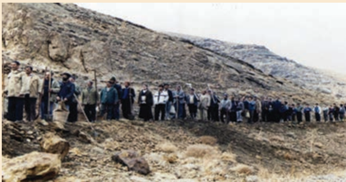
شکل ۱۲-۵- لایروبی جوی‌های آب نمونه‌ای از همکاری اهالی با یکدیگر - سمیرم

هرچند با مکانیزه شدن کشاورزی و صنعتی‌تر شدن جامعه، این مراسم کمرنگ شده ولی همیاری و تعاون همچنان در فرهنگ ایرانی - اسلامی ما از اهمیت خاصی برخوردار است.