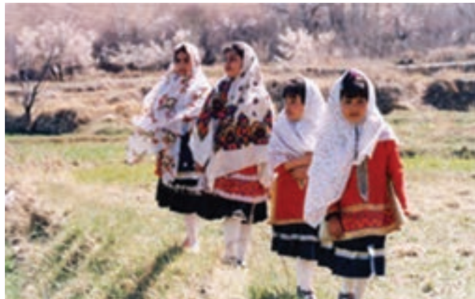
شکل ۵-۶- لباس سنتی مردم ایبانه

لباس سنتی مردم ایبانه ۱ : این نوع لباس بیانگر ویژگی‌های جغرافیایی، باورها، اعتقادات و ویژگی‌های فرهنگی مردم این قسمت از استان است که ریشه در اعماق تاریخ ایرانیان دارد و نشانگر سنت‌های زیبای ایران باستان است.