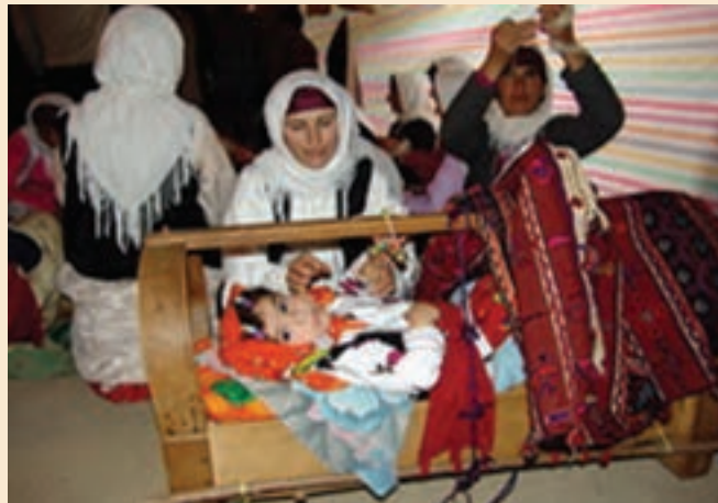
شکل ۱-۵- لالایی و انتقال فرهنگ

لالایی ها : لالایی ها، بخشی از ادبیات شفاهی سرزمین ماست که در کنار افسانه ها و قصه ها در گذشته کاربرد بسیار داشته است. لالایی، آوازی است که مادران برای خواباندن کودک شیرخواره می خوانند. لالایی نخستین ارتباط کلامی و رابطه همسخنی مادر با کودک است که برای هردو، این موسیقی آهنگین، موجب آرامش جسم و روح مادر و کودک می شود. در مناطق مختلف استان اصفهان، لالایی و دوبیتی های محلی، به طور خودجوش توسط زنان و مردان با ذوق در وزن های ساده سروده شده است.