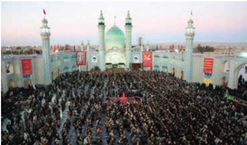
شکل ۳-۵- مراسم سوگواری حضرت امام حسین (ع) - آران و بیدگل

الف) تعزیه و روضه‌خوانی: از مهم‌ترین انواع ارتباطات سنتی و هنرهای نمایشی است که در آن، ترکیبی از هنرها، آداب و عناصر مختلف به کار گرفته می‌شود. تعزیه در لغت به معنای «سوگواری و یاد بود عزیزان در گذشته» است و در اصطلاح، به نوعی نمایش مذهبی و آداب و رسوم خاص اطلاق می‌شود که متناسب با شرایط خاص تاریخی، یادآور ظلم و جور حکام وقت، یادآور ستمکاری‌ها به امام حسین (ع) و یاران اوست. مضمون تعزیه، رویارویی دو نیروی خوب و بد، نور و ظلمت است. در تمام روستاها و شهرهای استان اصفهان، تعزیه به مناسبت‌های مختلف انجام می‌گیرد. در همه جای استان اصفهان به ویژه دههٔ محرم، این مراسم با شور و علاقهٔ وافری اجرا می‌شود؛ برای نمونه می‌توان از مراسم نخل‌گردانی و تعزیهٔ روستای ایبانه، و انواع دیگر نمایش‌های شهر نیاسر، بادرود، خوانسار، خمینی‌شهر و خوراسگان نام برد.