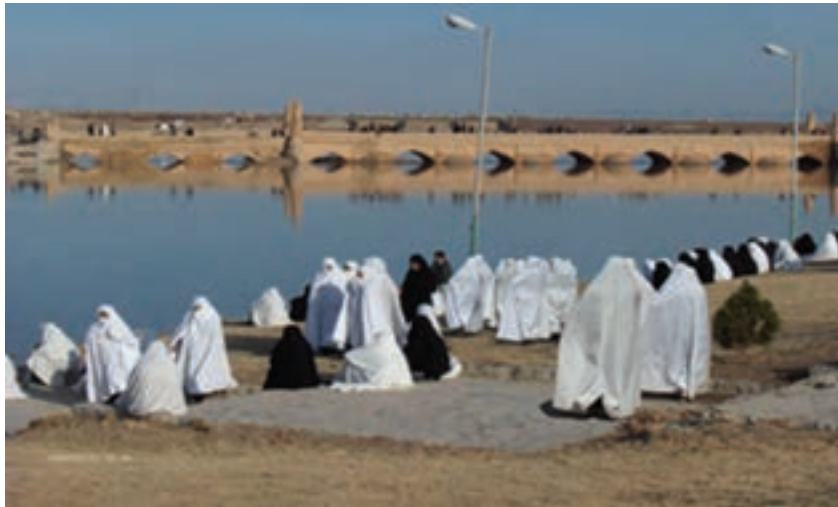
شکل ۷-۵- پوشش زنان و رزنه

چادر سفید و رزنه: پوشیدن چادر سفید، مشخصه منحصر به فرد شهر و رزنه است. گفته می‌شود که پوشیدن چادر و لباس سفید در این منطقه، دلایل تاریخی و جغرافیایی دارد: اغلب زنان و دختران این شهر به شیوه نیاکان خود، از چادر سفید استفاده می‌کنند. شرایط آب و هوایی منطقه، شغل کرباس‌بافی، کشت و کار پنبه و در دسترس نبودن پارچه‌های شهری در گذشته، از عوامل مؤثر در وجود این سنت است.