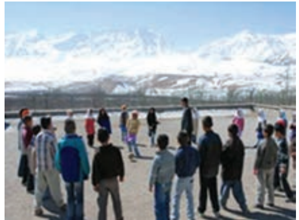
شکل ۲-۵- بازی‌های دسته‌جمعی