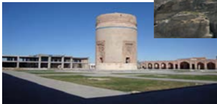
شکل ۱۱-۴- بقعه شیخ حیدر مشکین شهر