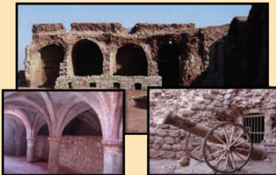
شکل ۷-۴ - قلعه پرتغالی‌ها در جزیره هرمز

قلعه پرتغالی‌ها در ضلع شمالی جزیره هرمز و در ساحل دریا قرار دارد که مهم‌ترین قلعه باقی مانده از روزگار تسلط پرتغالی‌ها بر سواحل جزایر خلیج فارس است. این قلعه که به فرمان آلفونسو آلبوکرک دریانورد پرتغالی در سال ۱۵۰۷ میلادی، در محلی موسوم به مورنا احداث شده، به لحاظ ساختار این قلعه به شکل چند ضلعی نامنظم است و از بنای بسیار محکمی برخوردار است. این بنا دیوارهایی به قطر ۵/۳ متر با چند برج به ارتفاع ۱۲ متر دارد و تأسیسات آن شامل انبارهای تسلیحات، آب انبار و اتاق‌هایی با سقف هلالی است. در زمان شاه عباس که به استعمار پرتغالی‌ها در ایران خاتمه داده شد، این قلعه به دست امام قلی خان از سرداران شاه عباس فتح گردید.