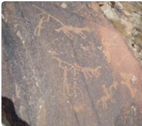
شکل ۱-۴- نقش سنگ نگاره‌های کوه ارنان

قبرهای خورشیدی در ارتفاعات کوه‌های بوهروک و نواحی جنوب غربی یزد که مربوط به دوران خورشید پرستی است و مربوط به سه تا شش هزار سال پیش است، نمونه‌های دیگری است. زراعت و مدنیت یزد، از مناطق مهریز و فهرج، یزد، رستاق، مید، اردکان و ابرکوه شروع شد اما کشاورزی در مهریز، فهرج و یزد در ابتدا وابسته به آب‌های سطحی ولی بعداً به دلیل کمبود ریزش‌های جوی و در کنار آن گرم شدن هوا مانند دیگر مناطق وابسته به آب‌های زیرزمینی، قنات (کاریز) شد.