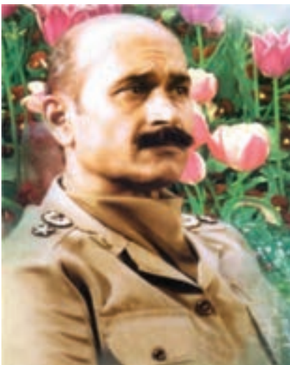
شکل ۱۰-۴- شهید فلاچی

از دیگر کمک‌های مردمی به رزمندگان علاوه بر اهدای کالا، می‌توان به اهدای خون نیز اشاره کرد. مردم هر وقت احساس می‌کردند به خون آن‌ها نیاز است، دریغ نمی‌کردند. همچنین، آنان با شرکت فعال در راهپیمایی‌ها به مناسبت‌های مختلف، به رغم بمب‌گذاری‌ها و حملات هوایی دشمن، موجب تقویت روحیه رزمندگان می‌شدند و دشمنان را مأیوس می‌کردند.