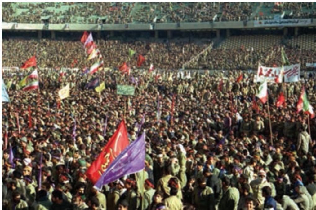
شکل ۷-۴- اعزام سراسری یکصد هزار نفری سپاه حضرت محمد (ص) از شهر تهران

شهر تهران به دلیل مرکزیت سیاسی، نقش بسیار ارزشمندی در دفاع از کیان اسلامی در دوران هشت سال دفاع مقدس بر عهده داشت. استان تهران اگرچه از نظر جغرافیایی دور از مرزها به سر می برد، ولی به واسطه پایتخت بودن و پشتیبانی خطوط جبهه، تقریباً مانند شهرهای مرزی مورد حملات هوایی قرار می گرفت. تهران به دلیل برخورداری از استعدادهایی در زمینه جذب و انتقال نیرو نسبت به سایر شهرها موقعیت ویژه ای داشت، به همین جهت، از اولین شهرهایی بود که در آغاز جنگ تحمیلی مورد حمله قرار گرفت. وجود پادگان های متعدد و فرودگاه های نظامی، خود استعداد بالقوه ای برای جذب نیروهایی شده بود که در بدو پیروزی انقلاب به دامن مردم پناه آورده بودند و پس از آغاز جنگ، عمده آن ها به پادگان ها برگشتند و به دفاع از سرزمین مقدس خود پرداختند. استان تهران با برخورداری از جمعیت کثیری نسبت به سایر استان ها و دارا بودن پادگان ها و مراکز دفاعی متعدد، به طور طبیعی نقش بسیار خطیری در دفاع از میهن اسلامی بر عهده داشت. با آغاز جنگ تحمیلی علیه جمهوری نوپای اسلامی، حضور داوطلبانه و فعال نیروهای مردمی، بسیاری از مشکلات را حل کرد. علاوه بر آن، حضور ارزشمند نیروهای مردمی در قالب نیروهای داوطلب، از پایگاه های بسیج ادارات و مساجد نیز شکوه دیگری از این عظمت را نشان داد که اوج آن را در اعزام سراسری یکصد هزار نفری سپاه حضرت محمد (ص) شاهد بودیم.