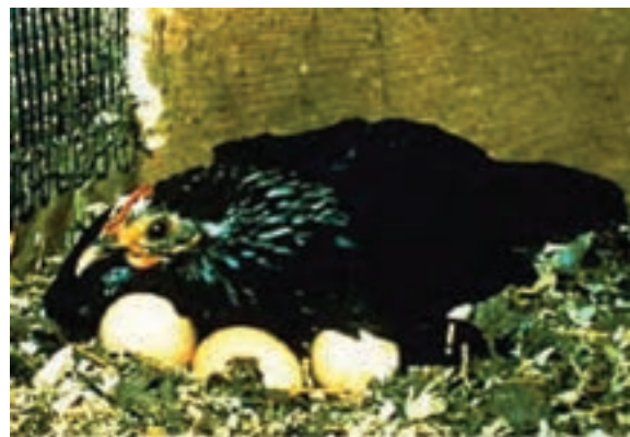
تصویر ۱-۲- جوجه‌کشی طبیعی