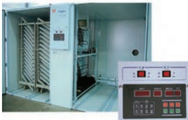
تصویر ۳-۲- انواع دستگاه جوجه‌کشی (ستر) بزرگ

سه روش (جریان هوای گرم، جریان آب گرم و قراردادن مقاومت‌های الکتریکی) گرم کنید. برای تأمین حرارت دستگاه از برق، گاز و یا نفت استفاده می‌شود. در ماشین‌های کوچک جوجه‌کشی، رطوبت از طریق قراردادن ظرف آب در زیر تخم‌مرغ‌ها و در ماشین‌های بزرگ با استفاده از منبع تأمین رطوبت همراه با المنت و یا به وسیله‌ی اسپری تولید می‌شود. تهیه در ماشین‌های کوچک از طریق باز و بسته کردن دریچه‌ها و در ماشین‌های بزرگ با نصب هواکش انجام می‌گردد. چرخش نیز در ماشین‌های کوچک دستی و در ماشین‌های بزرگ به صورت خودکار با جک‌هایی متصل به کمپرسور باد انجام می‌شود.