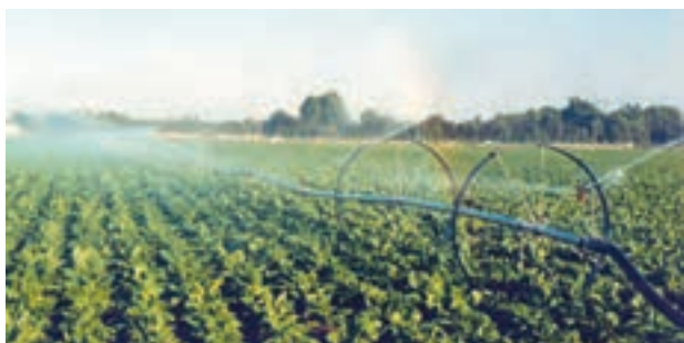
شکل ۵-۶- آبیاری بارانی ویل موو