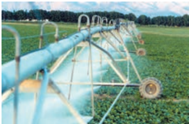
شکل ۸-۶- آبیاری بارانی خطی