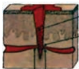
تشکیل لخته رگ‌خونی آسیب دیده انقباض رگ خونی

این که بدن شما می‌تواند به‌طور خودکار باعث کنترل خونریزی شود یا نه بستگی به مکان و شدت جراحات دارد. به‌طور کلی بدن از دو طریق سعی در کنترل خونریزی دارد.