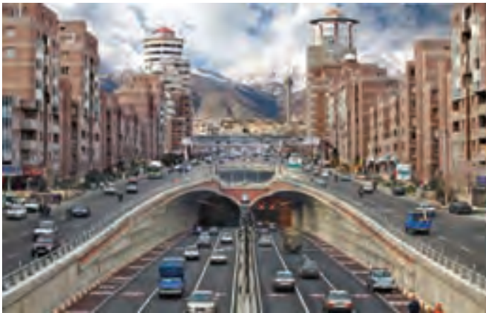
شکل ۹-۱- ورودی تونل توحید - تهران

امروزه احداث انواع پروژه‌های عمرانی مانند سدها، نیروگاه‌ها، بزرگراه‌ها، بیمارستان‌ها، مکان‌یابی شهرک‌ها، مجتمع‌های تجاری و مسکونی، آسمانخراش‌ها و ... همه نیازمند شناخت جنس و ساختار تشکیل دهنده زمین بی آن است. پس برای در امان ماندن از پدیده‌های طبیعی مانند زمین‌لرزه، رانش زمین، سقوط سنگ و غیره باید خصوصیات زمین را بطور جدی بررسی کرد. امروزه اهمیت این موضوع تا آن حد است که حضور کارشناس زمین‌شناس در شهرداری‌ها و محیط زیست قطعی و اجتناب‌ناپذیر می‌باشد (شکل ۹-۱).