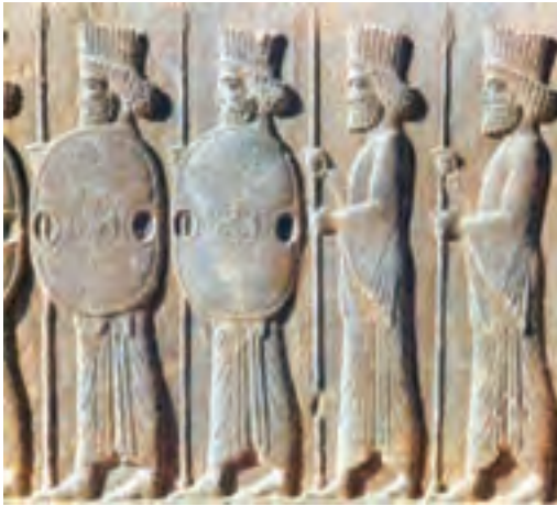
شکل ۱-۵- ادوات نظامی هخامنشیان

انواع ذخایر معدنی فلزی و غیرفلزی از دیگر ویژگی‌های بخش بیرونی پوسته زمین است که آگاهی نسبی از نحوه تشکیل آنها نیاز به کسب تخصص در رشته زمین‌شناسی دارد. توجه به ذخایر معدنی در ایران به هزاران سال قبل باز می‌گردد. به عنوان مثال ایرانیان در زمان هخامنشیان با دسترسی به ذخایر سنگ آهن، از آن در ساخت وسایل و ابزار جنگی بهره جسته و بدین طریق از سرزمین پهناور ایران در مقابل هجوم بیگانگان محافظت کردند (شکل ۱-۵).