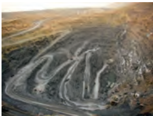
شکل ۱۲-۱- معدن سرب و روی ایرانکوه - اصفهان

به دنبال مکان‌هایی هستند که در آن ذخایر معدنی ارزشمند مانند مس، آهن، طلا، نقره، الماس و دیگر گوهرها و ... قرار دارند (شکل ۱۲-۱).