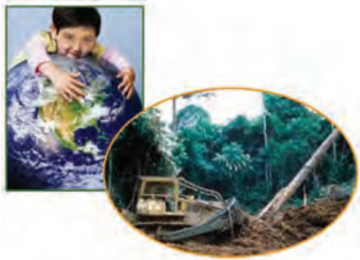
شکل ۱۰-۱- تخریب و حفاظت از محیط زیست

آیا بشر مجاز است، به هر میزان که می‌خواهد گازهای آلاینده تولید نماید؟ چرا باید دمای زمین به صورت غیرعادی افزایش یابد؟ آیا حق استفاده بی‌رویه از سفره‌های آب زیرزمینی را دارد؟ حجم زباله‌های دفن شده در خاک باید چه مقدار باشد؟ همه و همه نیاز به بازنگری مجدد رفتار بشر در مواجهه با کره زمین دارد. در همین رابطه سازمان علمی - فرهنگی یونسکو، سال ۲۰۰۸ میلادی را سال سیاره زمین نامگذاری کرد، هدف از این اقدام، توجه انسان‌ها به کره زمین به عنوان تنها مکان برای زندگی است که استفاده نادرست از آن موجب نابودی زمین خواهد شد.