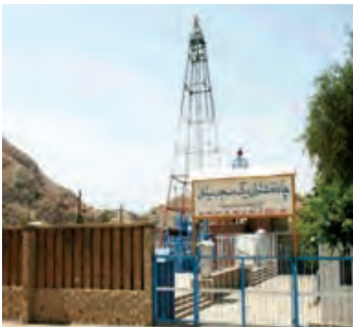
شکل ۸-۱- ب - موزه نفت در محل اولین چاه نفت خاورمیانه -

هیچ با خود اندیشیده اید، که اگر این معادن شناخته نشده بودند آیا زندگی بر روی کره زمین به این سادگی مقدور بود؟ خوشبختانه کشور ایران از جمله کشورهای معدنی جهان است که دارای معادن متعدد آهن، مس، سرب و روی، طلا و ... است. همچنین بیش از صدسال قبل تاکنون با کشف نفت در حوالی مسجدسلیمان اقتصاد کشورمان متوجه این نعمت خدادادی شده است (شکل ۸-۱- الف و ب). این قابلیت ها سبب گردیده تا ایران در بین کشورهای جهان، کشوری قدرتمند و تأثیرگذار باشد.