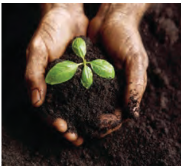
شکل ۱-۴- خاک محل رویش گیاه

تنها مکان مناسب برای سکونتگاه بشر سیاره زمین است. خارجی ترین بخش زمین معمولاً از خاک تشکیل شده است. خاک محصول هوازدگی و فرسایش سنگ‌هاست و محل رویش گیاهان می باشد (شکل ۱-۴). پس غذای انسان و تعداد زیادی از موجودات زنده وابسته به خاک است.