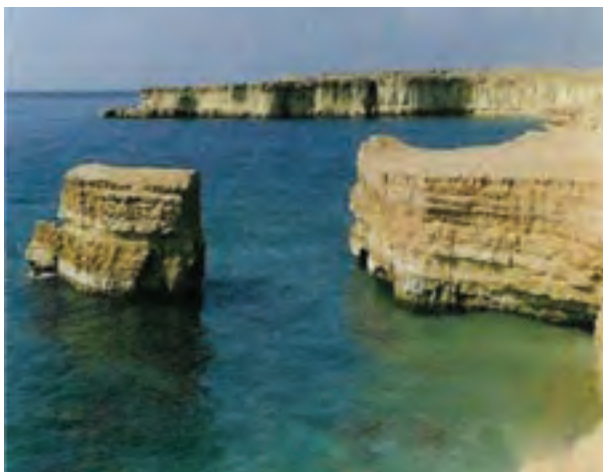
شکل ۱-۳- سواحل جنوبی ایران

تنها مکان مناسب برای سکونتگاه بشر سیاره زمین است. خارجی ترین بخش زمین معمولاً از خاک تشکیل شده است. خاک محصول هوازدگی و فرسایش سنگ‌هاست و محل رویش گیاهان می باشد (شکل ۱-۴). پس غذای انسان و تعداد زیادی از موجودات زنده وابسته به خاک است.