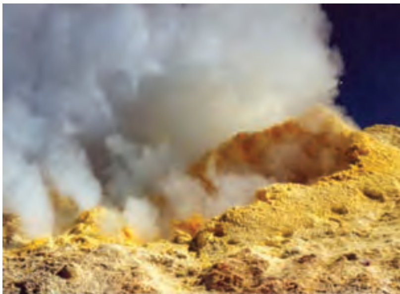
شکل ۱۱-۱ دهانه اصلی آتشفشان تفتان

شاید اینک پذیرفته باشید که برای زندگی بر روی کره زمین لازم است تا حدی با خصوصیات کره زمین در قالب درس زمین‌شناسی آشنا شوید.