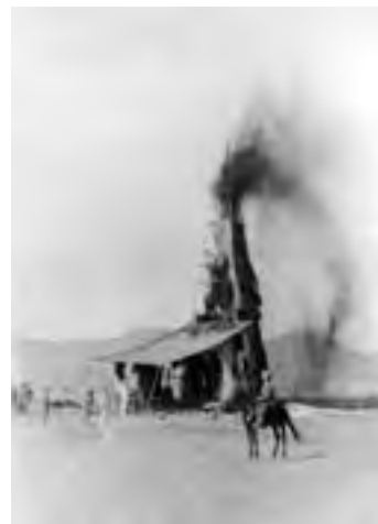
شکل ۸-۱- الف - فوران نفت از اولین چاه

نفت خاورمیانه در سال ۱۹۰۸م - مسجد سلیمان