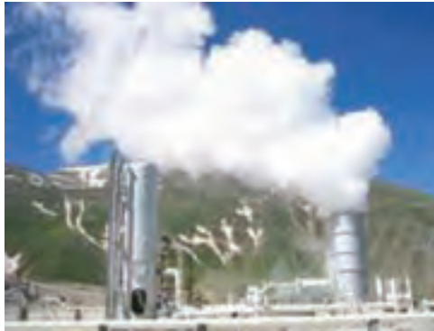
شکل ۷-۱- نیروگاه زمین گرمایی مشکین شهر - اردبیل

استفاده از مواد معدنی تنها محدود به همین موارد نمی گردد. اگر به اطرافمان خوب نگاه کنیم، مثلاً مدادی که با آن می نویسیم، عینکی که به کمک آن می بینیم، وسایلی که با آن زندگی می کنیم، داروهای که برای التیام دردهایمان از آن استفاده می کنیم و حتی خمیردندانی که هرروز از آن استفاده می کنیم، همه و همه در گروه موادی است که از زمین استخراج می شود.