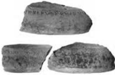
نمونه‌هایی از مکتوبات

هم‌چنین هیچ‌کس به تنهایی نمی‌تواند به گونه‌ای همه‌جانبه و دقیق درباره علل و انگیزه اعمالی که انسان‌ها در گذشته براساس اهداف، اندیشه‌ها و خواسته‌های خود انجام داده‌اند، اظهارنظر کند؛ بلکه هرکس به اندازه شناخت و براساس علاقه‌ای که نسبت به بخشی از رخداد‌های گذشته دارد، اظهارنظر می‌کند. به همین جهت نتایج مطالعات تاریخی افراد مختلف درباره موضوعی واحد کاملاً یکسان نیست و قضاوت‌ها ممکن است باهم متفاوت باشند. بنابراین نتایج حاصل از مطالعه پدیده‌های تاریخی، نسبی است.