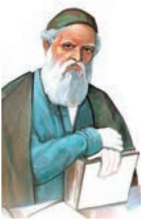
عمر خیام، دانشمند برجسته ایرانی

ملکشاه سلجوقی (۴۶۵-۴۸۵ ق.م) و وزیر دانشمند و کاردان او خواجه نظام الملک، مجمعی از منجمان از سال ۴۶۷ ق.م به امر ملکشاه مأمور اصلاح تقویم شدند. سرانجام پس از چهار سال تلاش منجمان به رهبری عمر خیام ۱ متوجه شدند