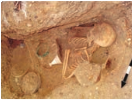
نمونه‌هایی از محسوسات