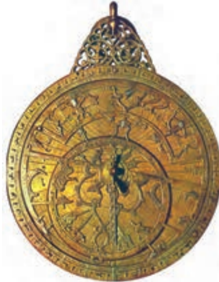
نمونه‌ای از اسطرلاب‌هایی که در گذشته برای اندازه‌گیری زمان و جهت‌یابی مورد استفاده ستاره‌شناسان و دریانوردان قرار می‌گرفت.