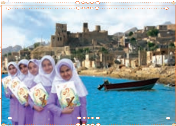
انس با قرآن کریم در استان بوشهر

با راهنمایی آموزگار خود پس از آوردن قرآن کریم از دفتر مدرسه، آن را به صورت تصادفی باز کنید و از روی آن بخوانید.