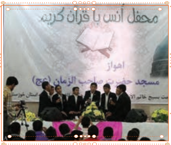
انس با قرآن کریم در استان خوزستان

با راهنمایی آموزگار خود پس از آوردن قرآن کریم از دفتر مدرسه، آن را به صورت تصادفی باز کنید و از روی آن بخوانید.