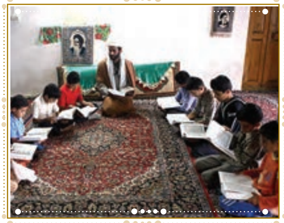
انس با قرآن کریم در استان فارس، شهرستان داراب

با راهنمایی آموزگار خود پس از آوردن قرآن کریم از دفتر مدرسه، آن را به صورت تصادفی باز کنید و از روی آن بخوانید.