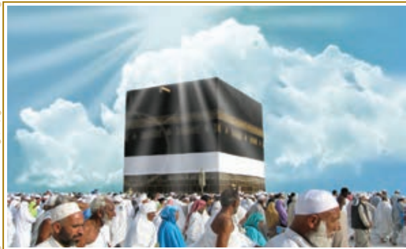
حج، نماد برادری و وحدت مسلمانان جهان