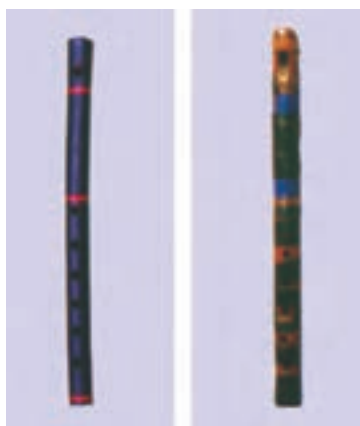
نی لبک گیلان (منطقه گنول)

نی لبک‌ها گروهی از هواصداها هستند که از گروه نی‌ها مشتق شده‌اند و در موسیقی غربی به ریکوردورها شهرت دارند. نی لبک‌ها در مقایسه با نی‌ها امکانات اجرایی محدودتری دارند اما نواختن و به‌صدا درآوردن آنها به خاطر ساختاری که دارند آسان‌تر از نی‌هاست. به همین دلیل است که جز نوازندگان حرفه‌ای، افراد دیگری نیز آنها را می‌نوازند. سازهای خانواده نی لبک در بعضی نواحی ایران متداول‌اند و با نام‌های مختلفی چون نی لبک، لبک، سیکاتک، شمشاد، توتک، سوتک، شوتک و ... شناخته می‌شوند.