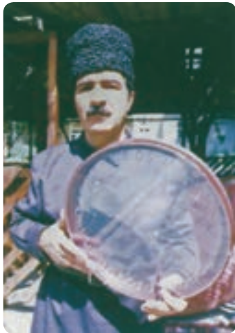
قوال در موسیقی عاشیقی

تکنیک‌های اجرایی قوال: قوال در مقایسه با سایر سازهای هم‌خانواده‌اش در نواحی ایران تکنیک‌های اجرایی متنوع و پیچیده‌تری دارد. پلنگ، اشاره، انواع ریز، استفاده از هر سه منطقه مرکزی، میانه و کناره از مهم‌ترین تکنیک‌های اجرایی دست راست هستند و استفاده از منطقه میانی و کناره، انواع ریز با همراهی دست راست، اشاره و ... از عمده‌ترین تکنیک‌های دست چپ به شمار می‌روند.