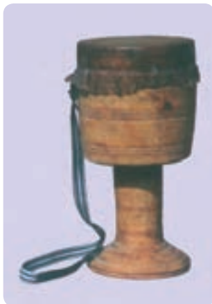
تمبک هرمزگان (میناب)

متداول در نواحی ایران یا چوبی هستند و یا فلزی. در بعضی مناطق فقط تمبک چوبی متداول است و در برخی دیگر فقط از تمبک فلزی استفاده می‌کنند. در بعضی مناطق نیز هر دو نوع متداول‌اند. تمبک‌های چوبی صرف‌نظر از اندازه آنها ویژگی‌های مشترک ساختاری با تمبک کلاسیک ایران دارند. تمبک فلزی معمولاً از ورق فلزی سیاه ساخته می‌شود و قسمت‌های مختلف آن با میخ و پَرچ به هم متصل شده‌اند. همه تمبک‌ها اعم از چوبی یا فلزی یک استوانه طینی دارند که روی دهانه آن پوست چسبانده شده است.