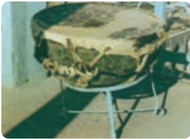
طبل تخم مرغی