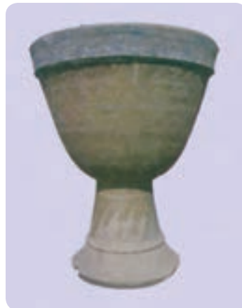
تمبک زورخانه (نمونه قدیم)