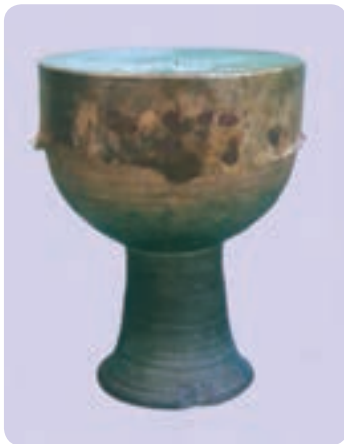
تمبک زورخانه (نمونه جدید)

زورخانه محل انجام ورزش باستانی ایران و ساختمانی سرپوشیده است که در وسط آن یک گود چندضلعی و در بالای گود سقف بلندی با نورگیر قرار دارد و در اطراف گود نیز جایگاه‌هایی برای تعویض لباس، گذاشتن اسباب‌های ورزش زورخانه، نشستن تماشاچی‌ها و سکوی سردم (محل نشستن مرشد) وجود دارد. هدایت مراسم ورزشی زورخانه امروزه برعهده فردی است که مرشد نامیده می‌شود. مرشدها ورزشکاران قدیمی هستند که از صدای خوش و ذوق موسیقی و شعر بهره‌مندند و وظیفه نواختن تمبک زورخانه، خواندن آواز و تعلیم و تربیت ورزشکاران جوان را برعهده دارند. تنها سازی که در زورخانه مورد استفاده قرار می‌گیرد - به جز زنگ - تمبک مخصوص زورخانه است. ۱ ویژگی‌های ظاهری و ساختاری تمبک زورخانه: تمبک زورخانه بزرگ‌ترین پوست صدای یک طرفه (یک طرف باز) از لحاظ اندازه در ایران است که با دست نواخته می‌شود. این ساز از جنس سفال یا بدنه‌ای یکپارچه است و پوست را با سریش بر دهانه آن می‌چسبانند. بدنه تمبک زورخانه از سه قسمت متصل به هم شامل محفظه و استوانه صوتی، گلوبی و دهانه شیپوری انتهایی تشکیل شده است. گلوبی، لوله‌ای نسبتاً استوانه‌ای است که به تدریج به سمت دهانه شیپوری گشاد می‌شود و انتهای آن به این دهانه وصل می‌شود.